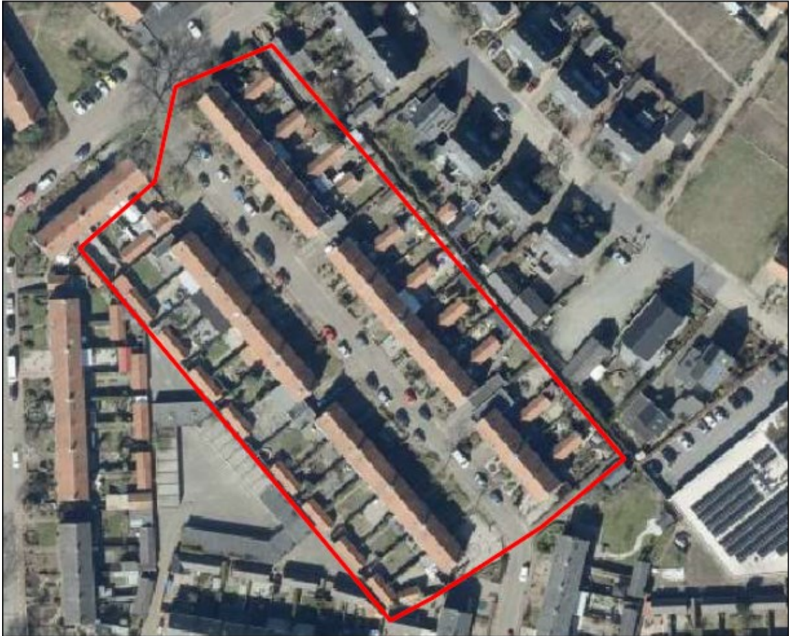
Figuur 1 Overzicht projectlocatie