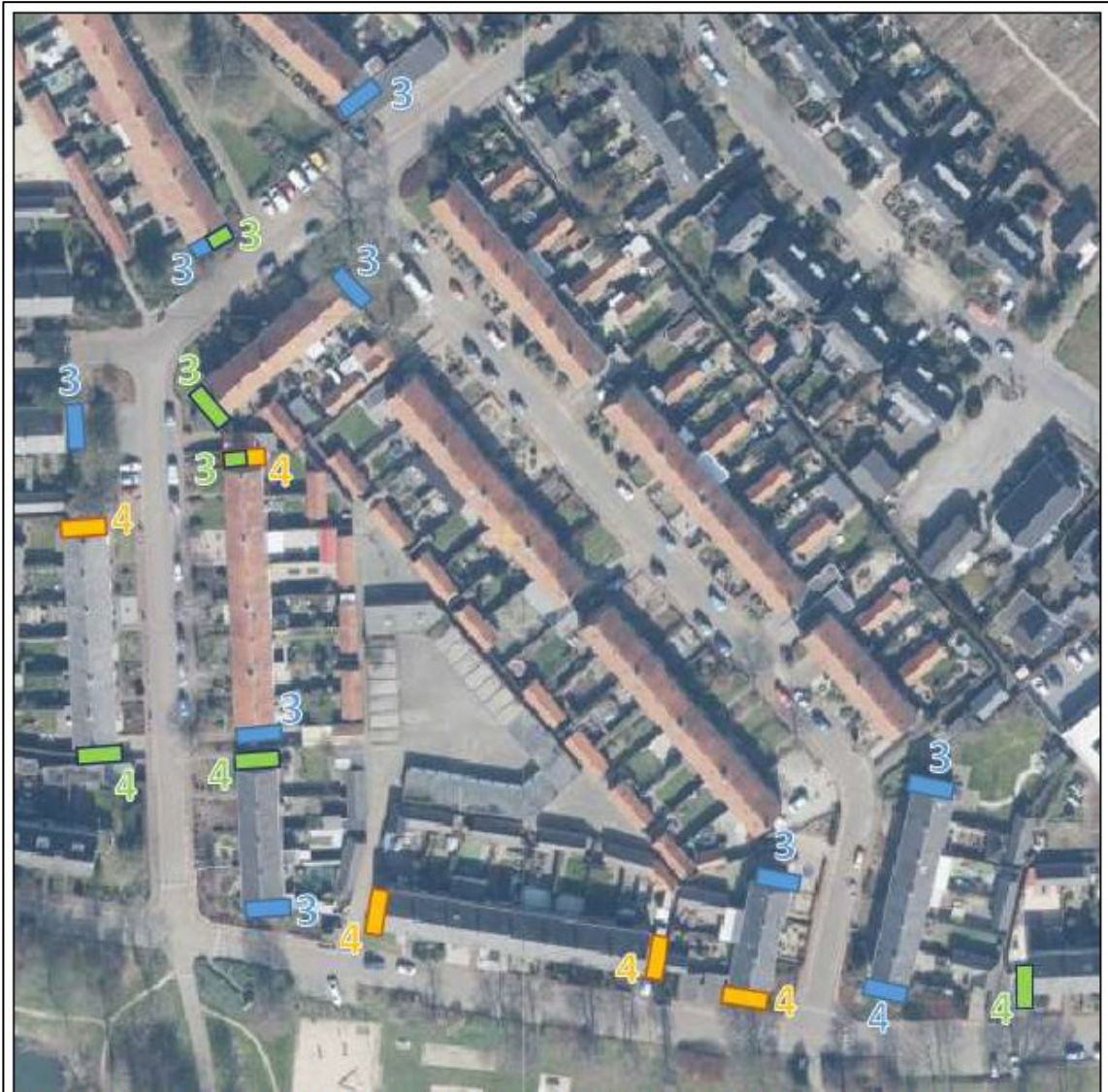
Figuur 3.1. Locaties aangeboden alternatieve, tijdelijke verblijfplaatsen voor de gewone dwergvleermuis en laatvlieger (blauwe blokken), huismuis (oranje blokken) en gierzwaluw (groene blokken) ten opzichte van het plangebied (rood omkaderd). Alle kasten bevinden zich binnen een straal van 200 meter. De cijfers geven het aantal kasten van de betreffende soort weer.