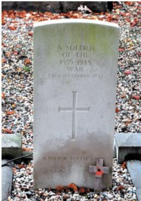
Grafnummer: 1e afdeling park 1 nr 203 Datering: 1944 Tenaamstelling: onbekend Materiaal: kalksteen Grafische vormgeving: kapitalen met schreef, verzonken Tekst: a soldier/ of the/ 1939-1945/ war, known unto God Figuratieve motieven: kruis Waardering Historisch: van internationaal belang als oorlogsgraf van een geallieerde soldaat