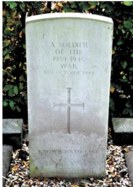
Grafnummer: 1e afdeling park 9 no 2 Datering: 1944 Tenaamstelling: onbekend Materiaal: kalksteen Grafische vormgeving: kapitalen met schreef, verzonken Tekst: a soldier/ of the/ 1939-1945/ war, known unto God Figuratieve motieven: kruis Waardering Historisch: van internationaal belang als oorlogsgraf van een geallieerde soldaat