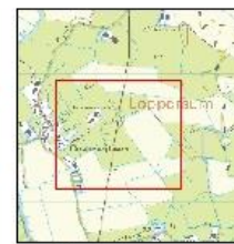
Overzicht schaal 1:25.000