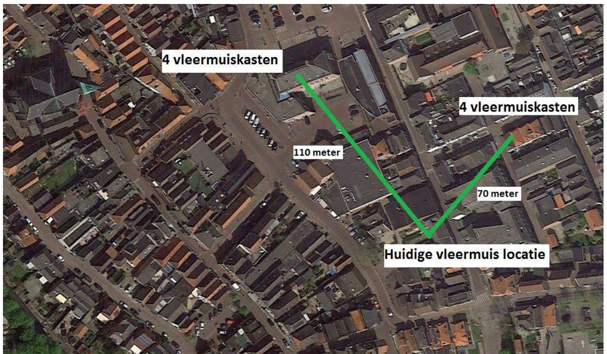
Locaties geplaatste tijdelijke kasten ten opzichte van originele verblijfplaats