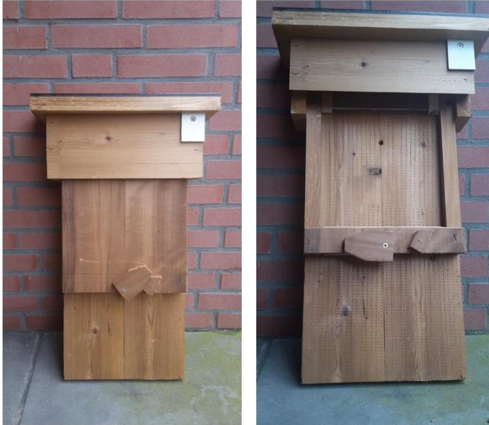
Geplaatste tijdelijk voorziening: houten voorziening (type Bloemhof)