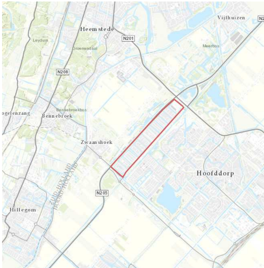
Figuur 2: Locatie wijk Floriande

De ligging van de wijk Floriande is weergegeven in onderstaande figuur. De wijk bestaat voornamelijk uit stedelijk gebied.