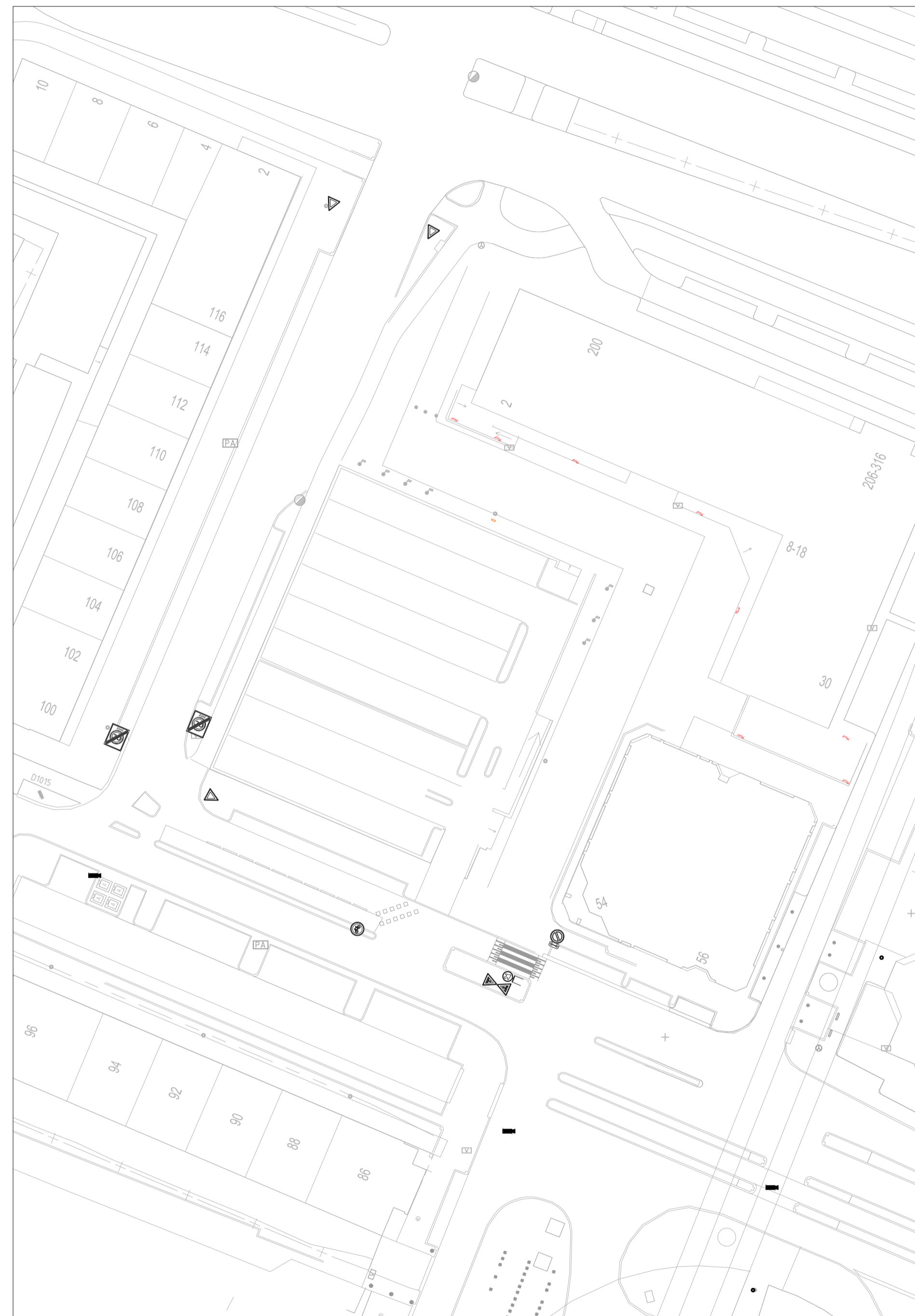
Bestaande en vervallen bebording