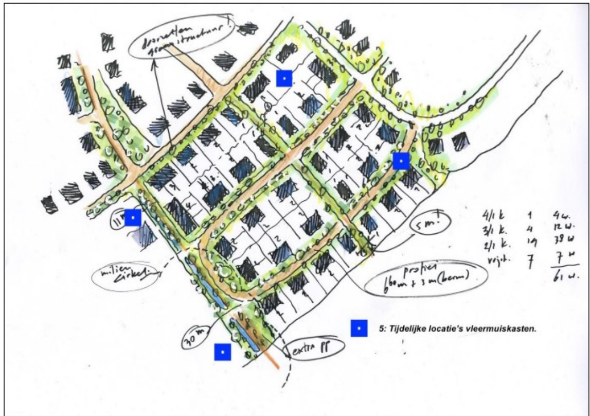
Figuur 2. Locaties tijdelijke vleermuiskasten (blauw vierkant) weergegeven in het schetsontwerp van de nieuwe situatie van het plangebied aan de Bloemstraat 93 te Huissen.