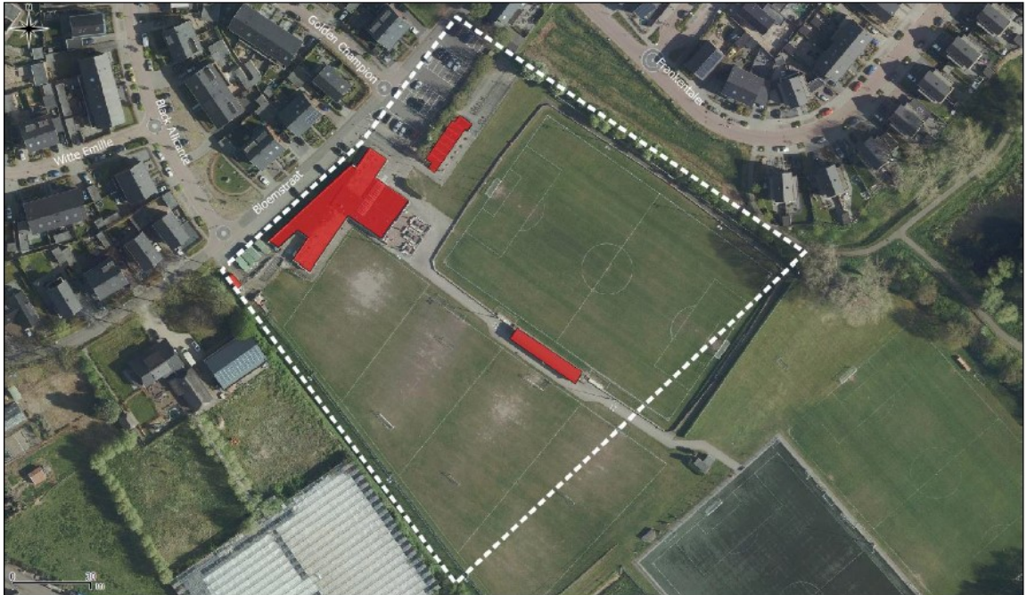
Figuur 1. Ligging en begrenzing plangebied Bloemstraat 93 te Huissen.