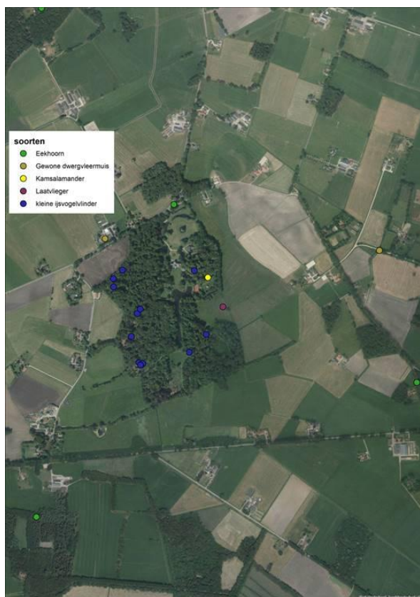
Figuur 1. Resultaten NDFF database.