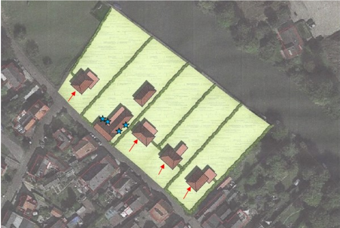
Figuur 2 Locaties van de tijdelijke (ster) en permanente (pijl) voorzieningen voor de gewone dwergvleermuis.