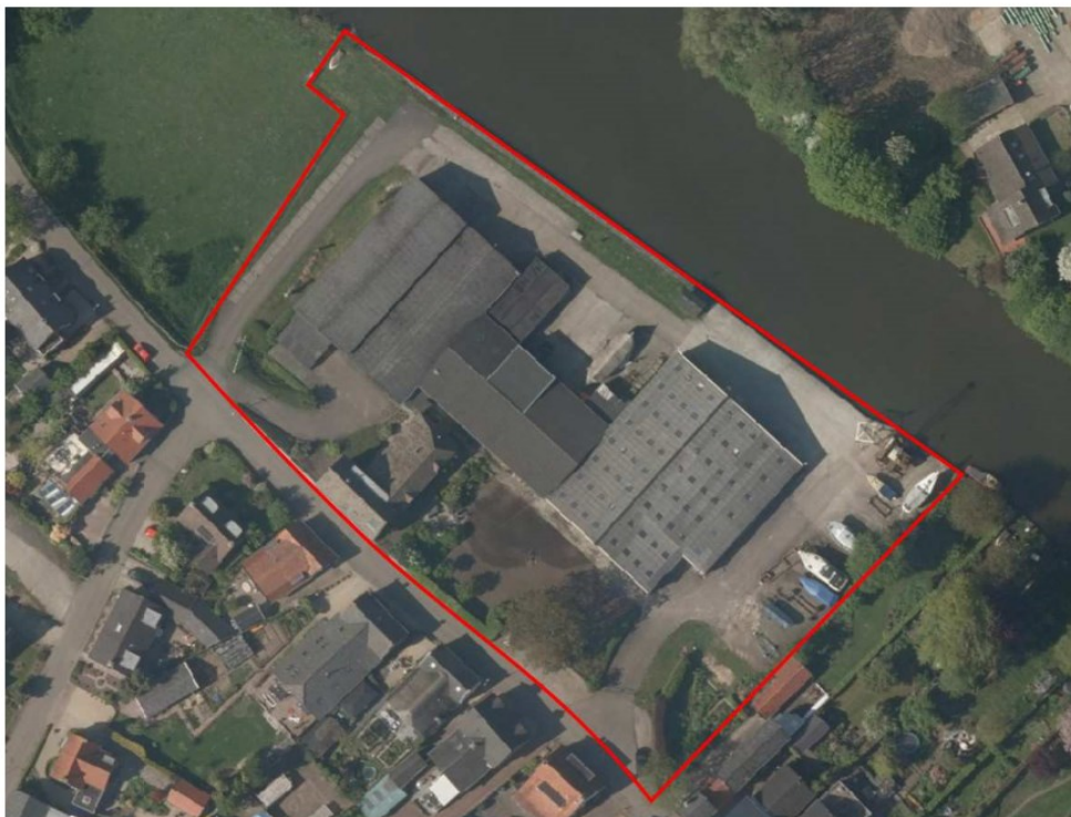
Figuur 1 Ligging plangebied (rode cirkel) en begrenzing plangebied (rood omljnd).