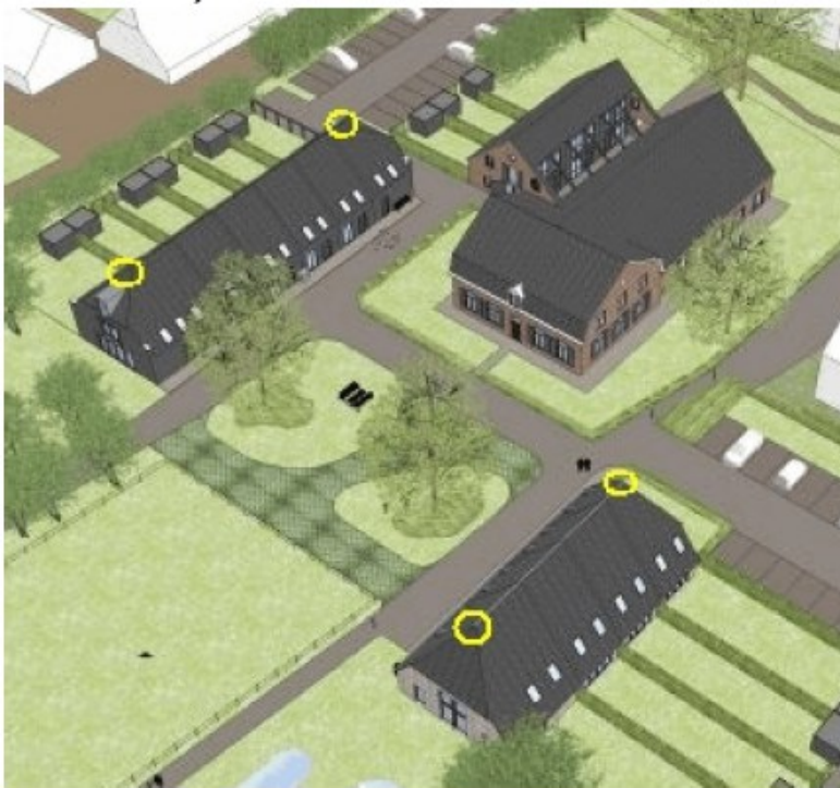
Figuur 5 Locaties van de permanente voorzieningen voor gewone grootoorvleermuis