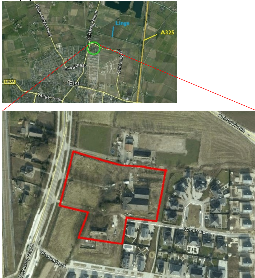
Figuur 1 Ligging plangebied (groene cirkel) en begrenzing plangebied (rood omkaderd)