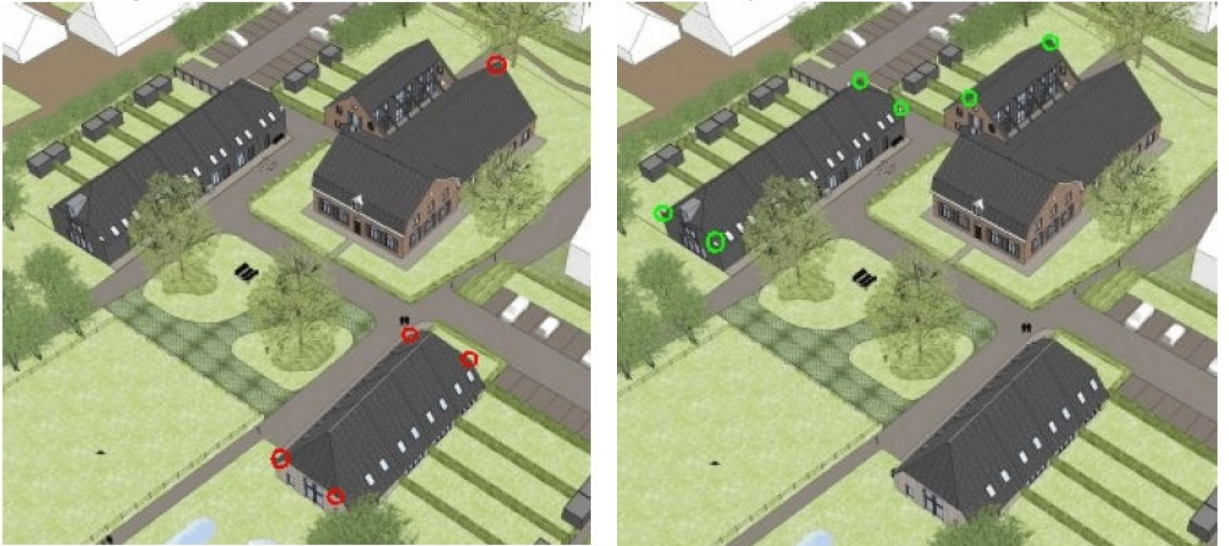
Figuur 4 Locaties van de permanente voorzieningen voor gewone (l) en ruige (r) dwergvleermuis