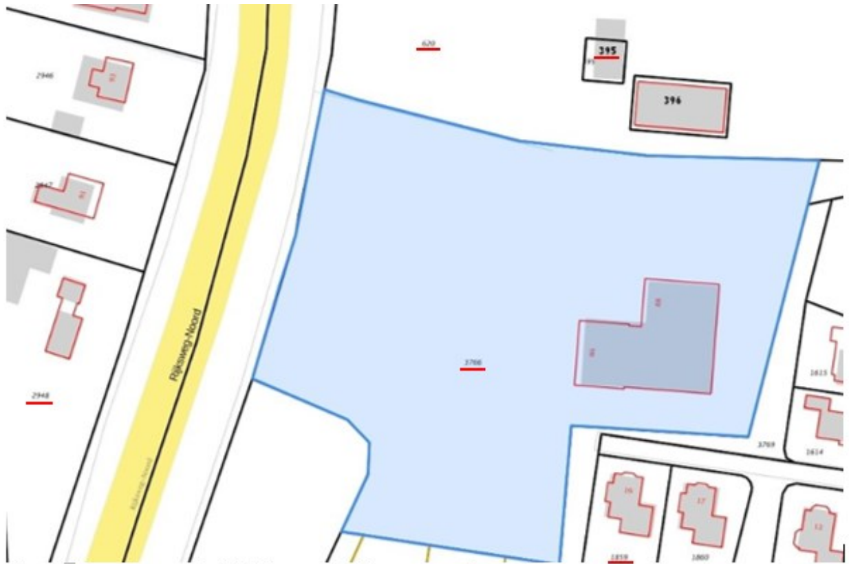
Figuur 3 Locaties van de tijdelijke voorzieningen voor vleermuizen (perceelnummers rood onderstreept).