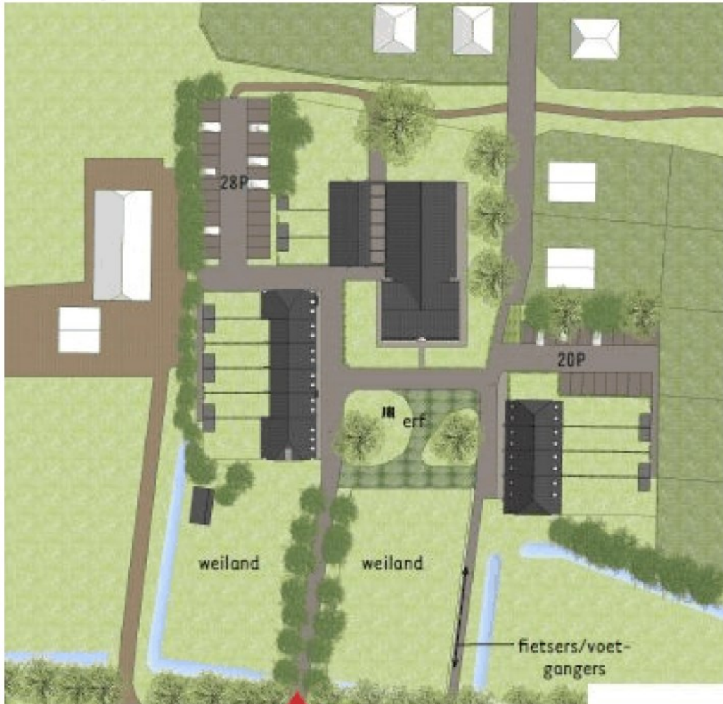
Figuur 2 Inrichtingsschets plangebied