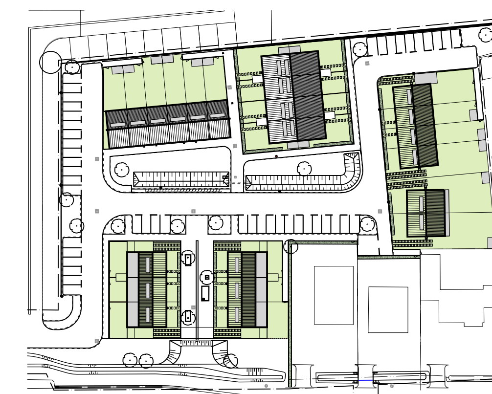
begane grond blok 6