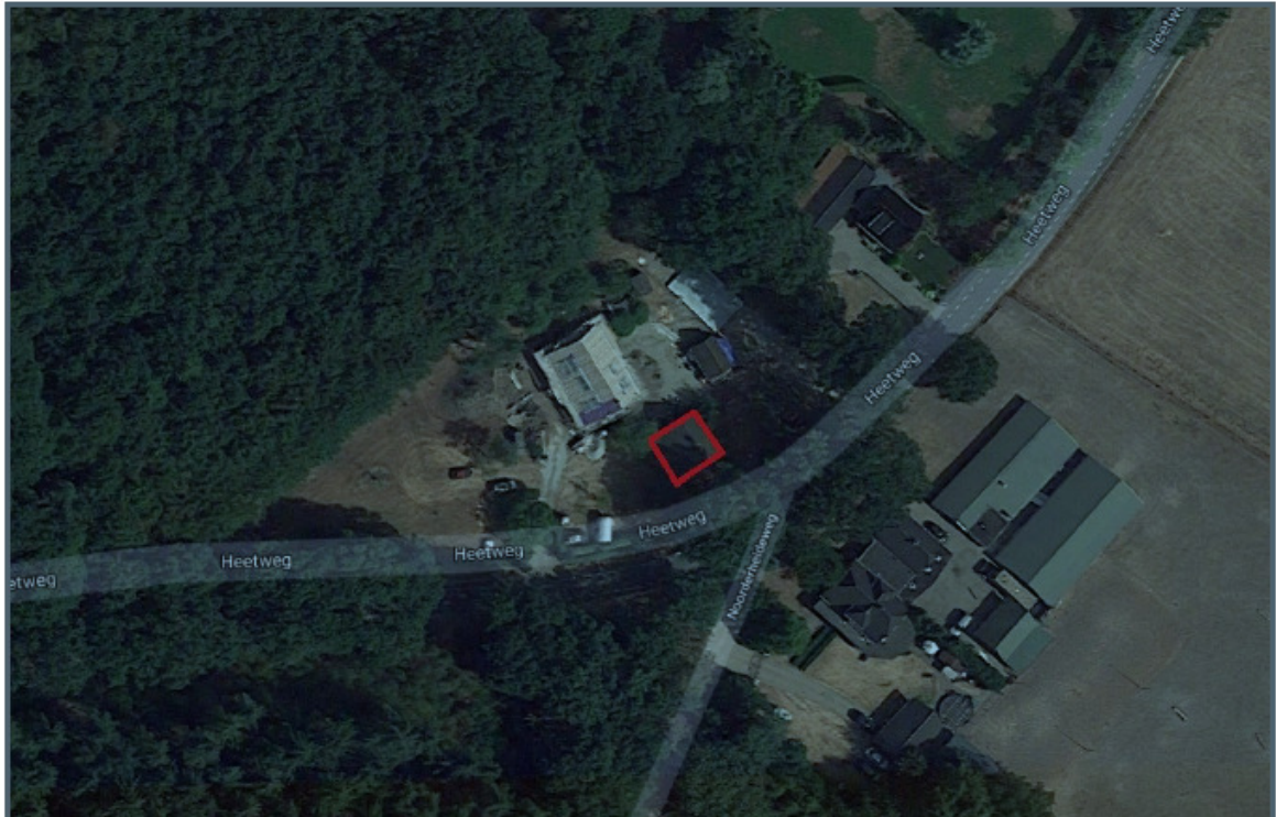
Figuur 2: Aanblik van de te slopen boerderij aan de Heetweg 12 te Kootwijk.

Figuur 1: Ligging van het plangebied, waarin de te slopen gebouwen aan de Heetweg 12 te Kootwijk gelegen zijn. De oude boerderij is gelegen binnen de rode contour.