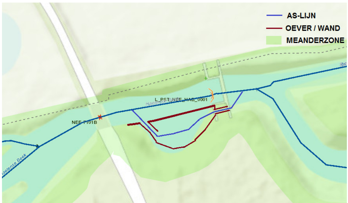
Schets toekomstige situatie (Legger)