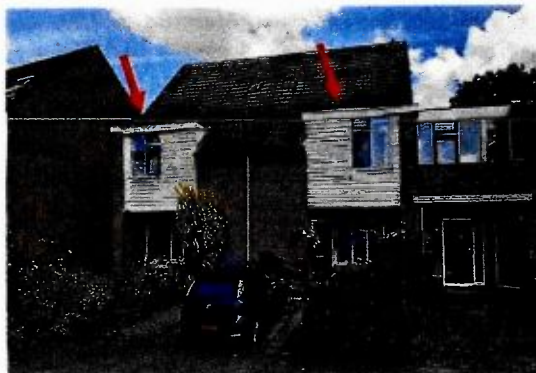
Figuur 7.1 | Voorbeeld boeiborden welke geschikt gemaakt gaan worden als verblijfplaatsen voor vleermuizen

Bij de kopse kant van De Linge 143 staat een behoorlijk grote boom vrij dicht tegen de woning aan. Het is in deze tijd van het jaar niet zo goed te beoordelen hoe dicht deze boom tegen de gevel aan zal groeien en hoeveel oppervlak deze dan in beslag neemt. Dat zal tijdens de ecologische begeleiding geïnventariseerd worden. Indien de boom de toegang tot de alternatieve verblijfplaats teveel zal blokkeren, wordt de kast ingebouwd in de kopgevel van De Linge 37.