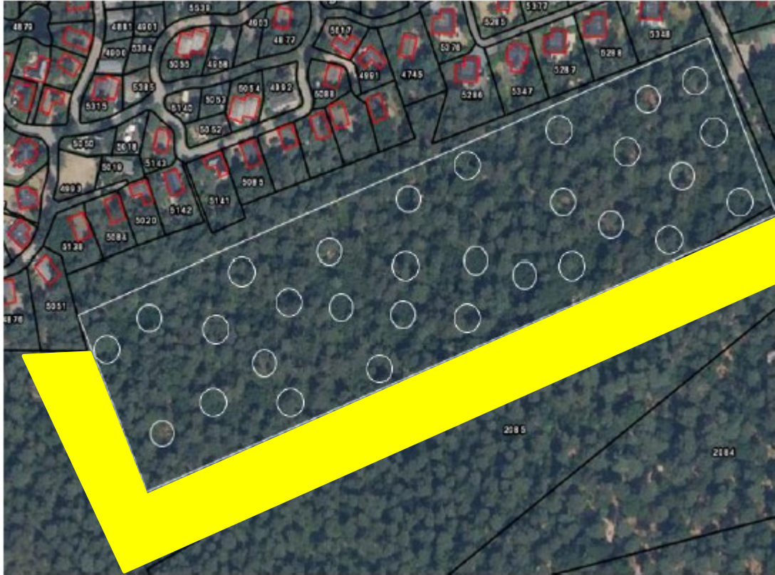
Figuur 3: Bij benadering de 30 vanglocaties voor hazelworm binnen plangebied en het beoogde uitzetgebied (geel).