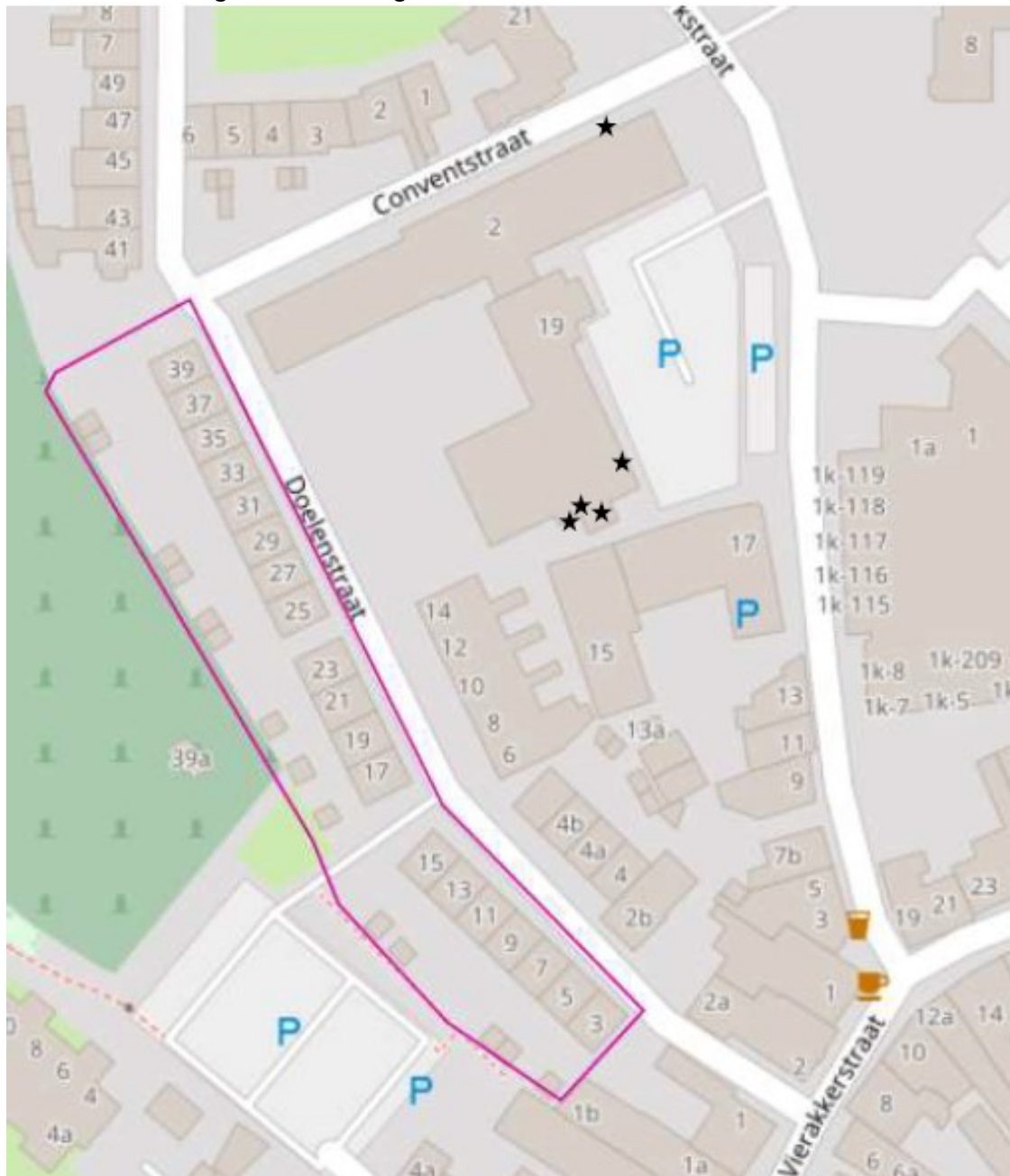
Figuur 2. Locaties tijdelijke vleermuiskasten (zwarte ster) t.o.v. het plangebied Doelenstraat 3 – 39 te Huissen.