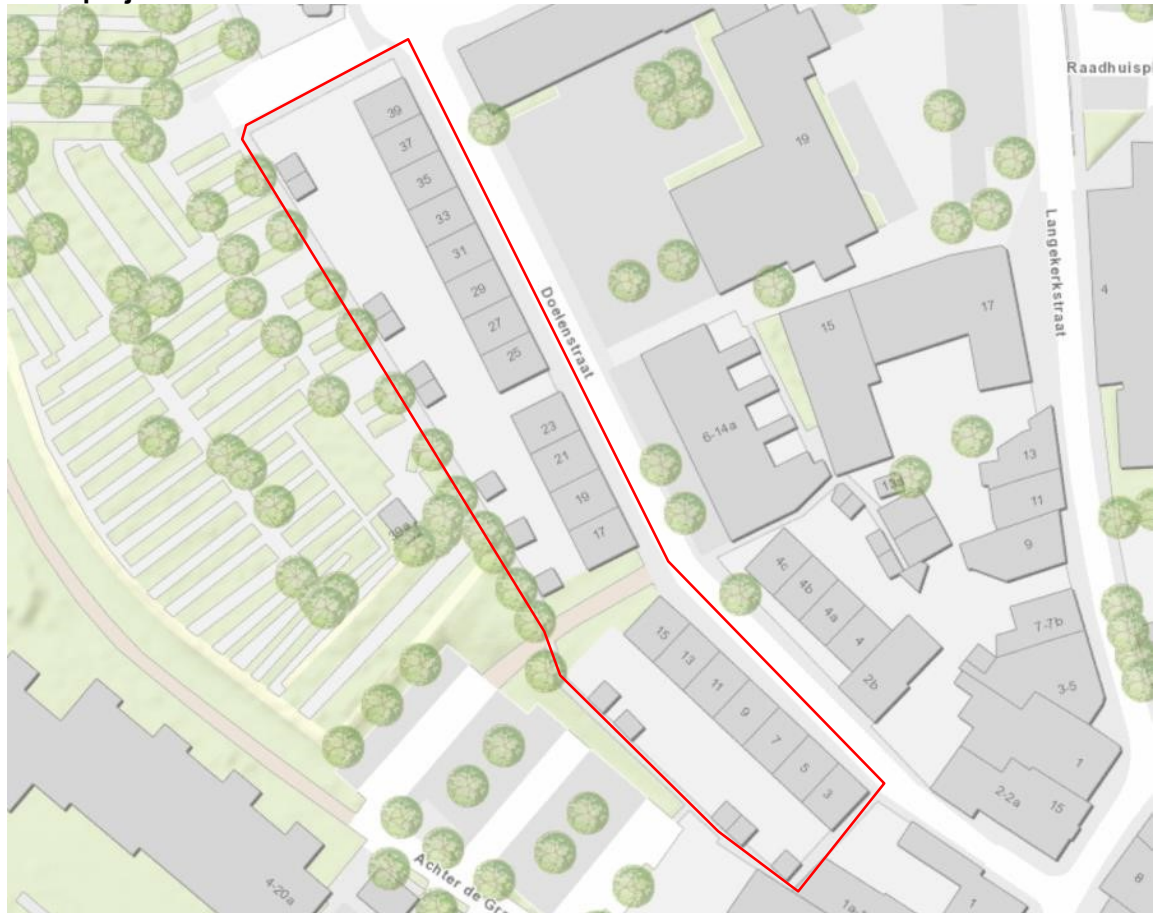
Figuur 1. Ligging en begrenzing plangebied Doelenstraat 3 – 39 te Huissen.