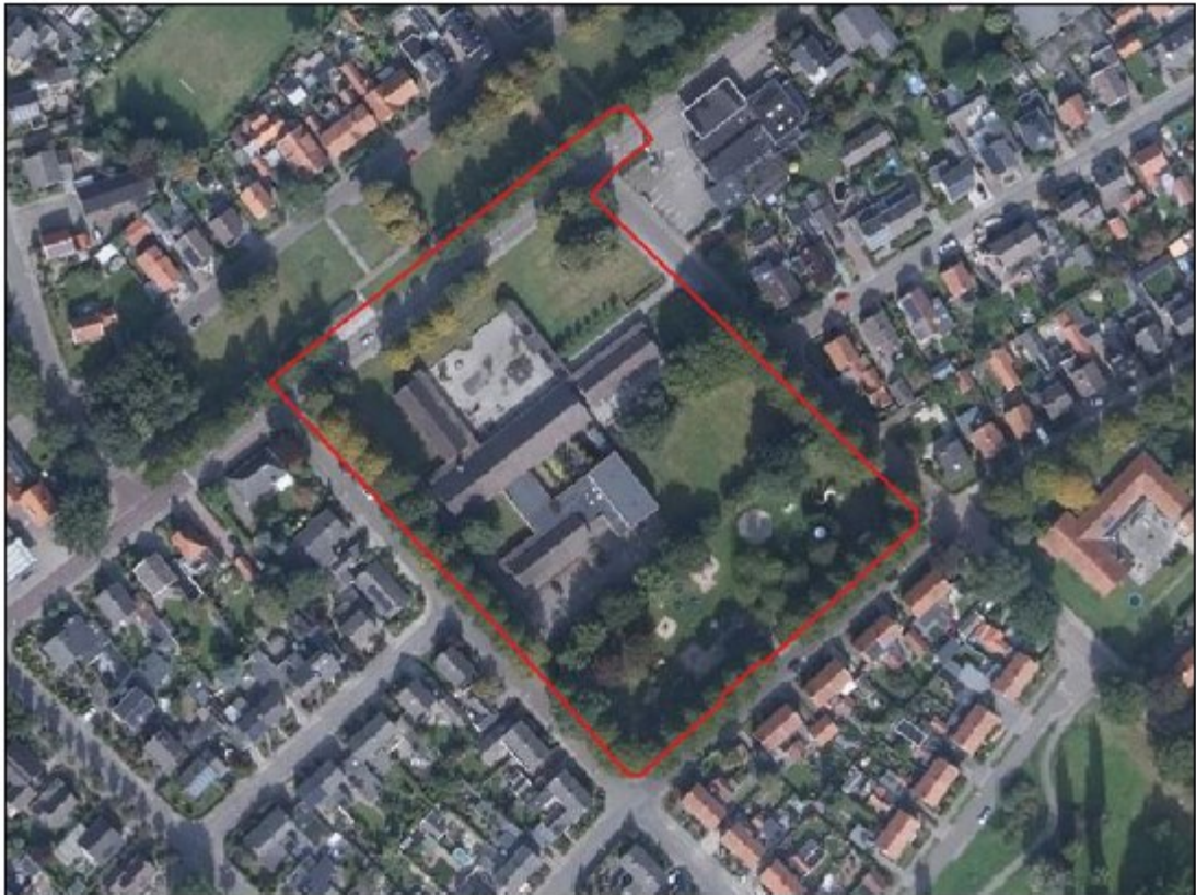
Figuur 1. Projectlocatie Varsseveldseweg 47, Lichtenvoorde. (rood omkaderd).