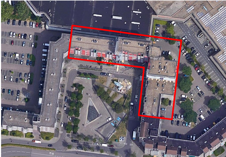
Figuur 1. Kaart plangebied (rood omkaderd)