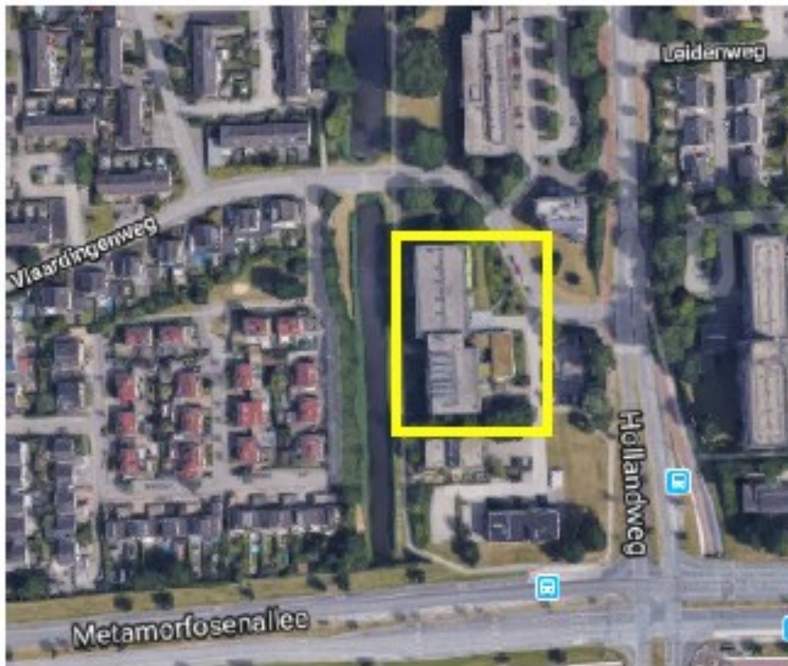
Figuur 1. Kaart plangebied (geel omkaderd).