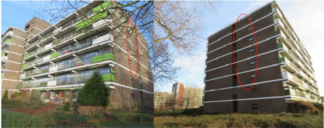
Figuur 2. Locatie permanente mitigatie in de vorm van spouwmuurcompartimenten (aangegeven met rode ellips). Links: zuidgevel, rechts: noordgevel.