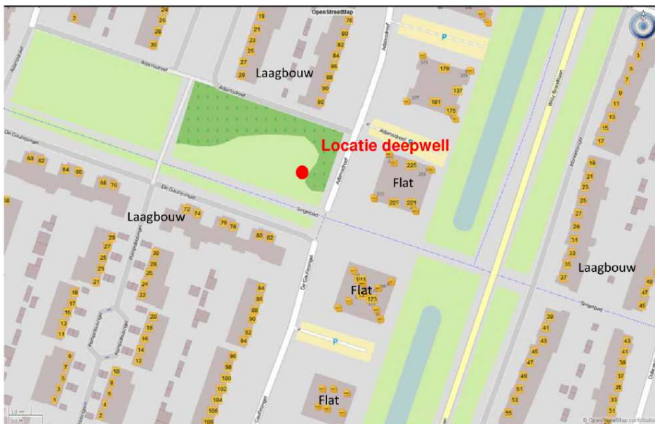
Figuur 1.1 Projectlocatie Enka, Ede (nieuwe locatie deepwell november 2017)

Onttrekkingsput: (Adamsdreef hoek Singelpad in Ede)