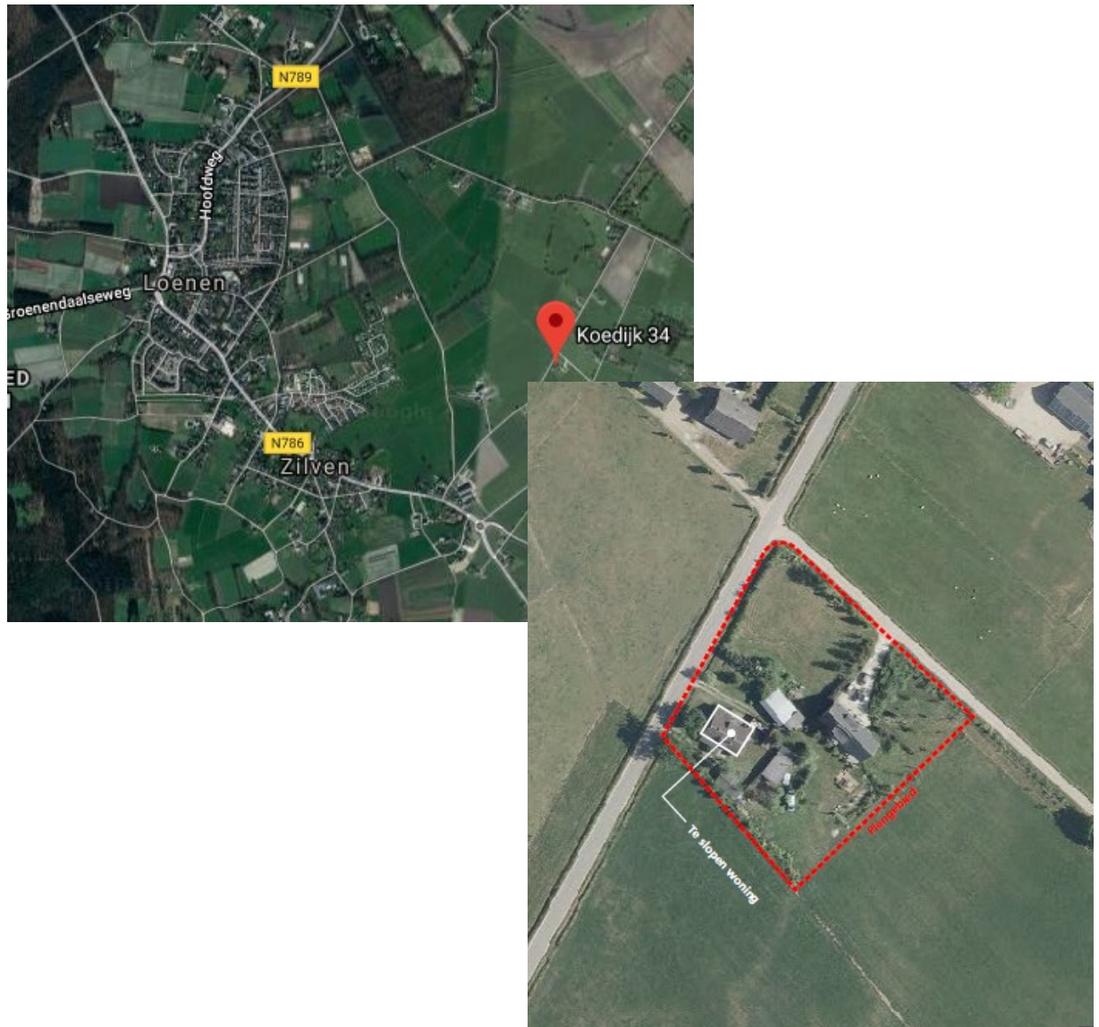
Figuur 1. Ligging en begrenzing plangebied (rode stippellijn)