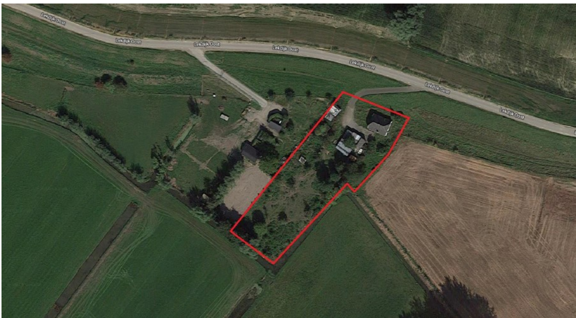
Figuur 1: Het plangebied (rood omlijnd) aan de Lekdijk Oost 38 te Zoelmond