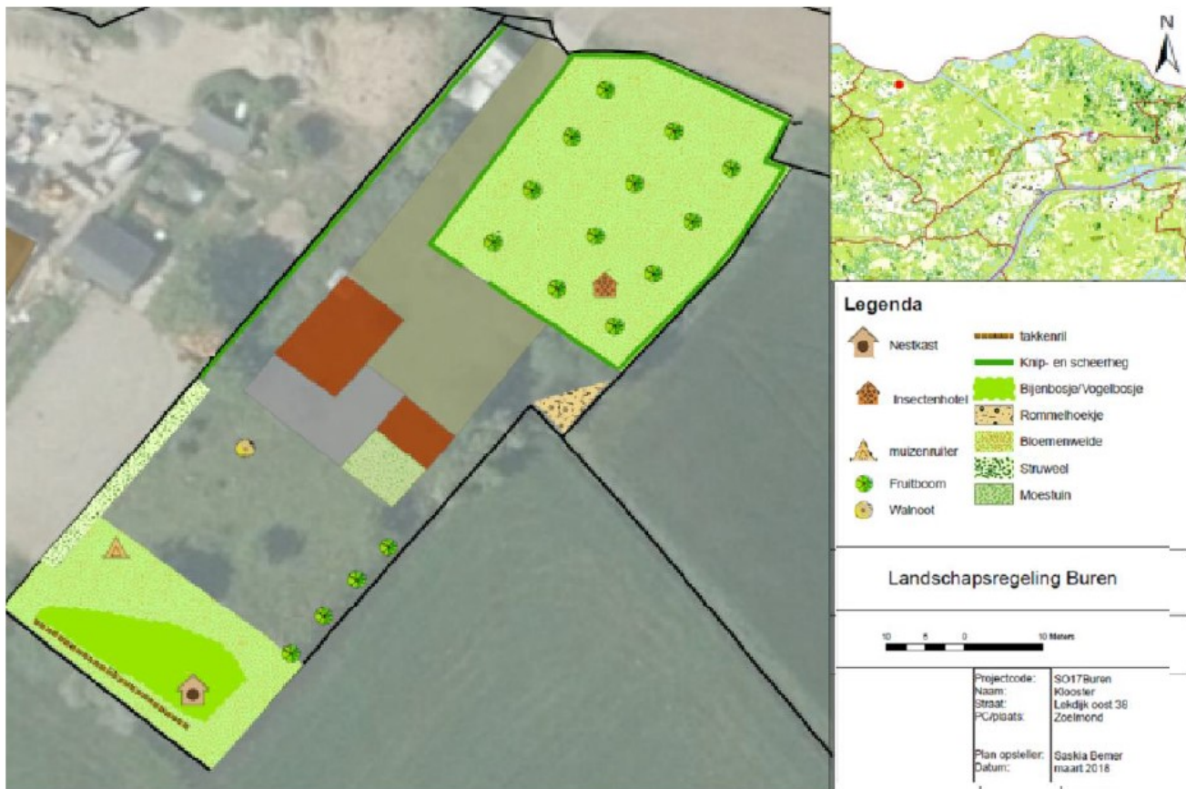
Figuur 3: Het inrichtingsplan