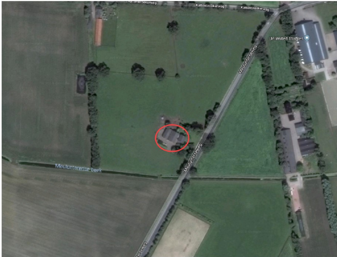
Figuur 1: Ligging van de te slopen woning met schuren aan de Meulunterseweg 81 te Lunteren