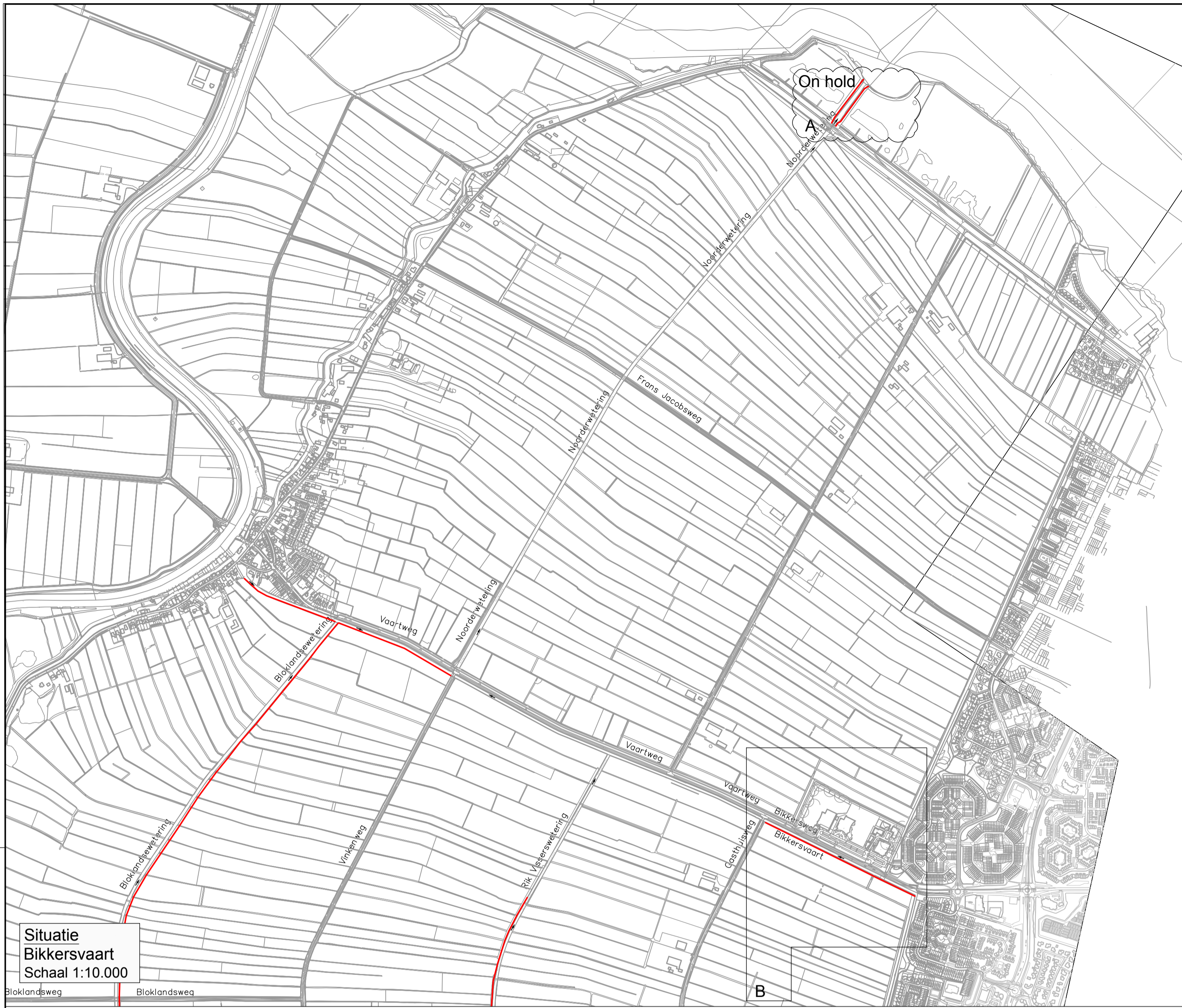
Situatie Bikkersvaart Schaal 1:10.000