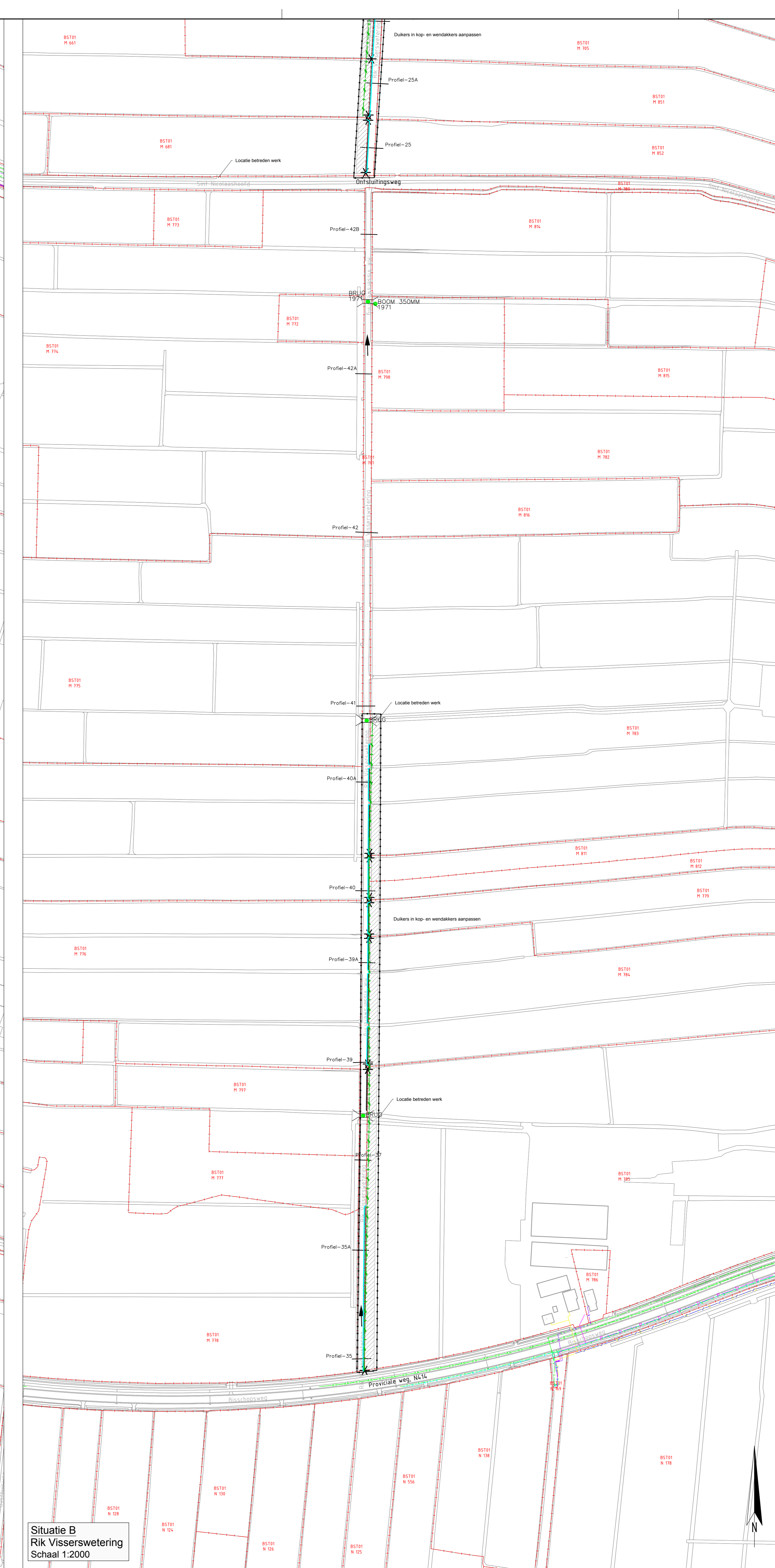
Situatie B Rik Visserswetering Schaal 1:2000