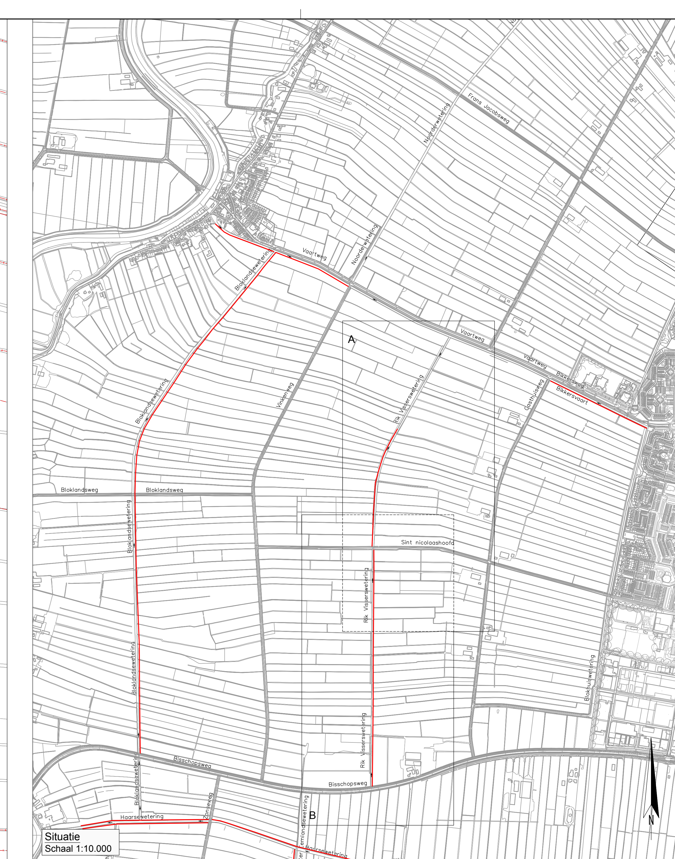
Situatie Schaal 1:10.000