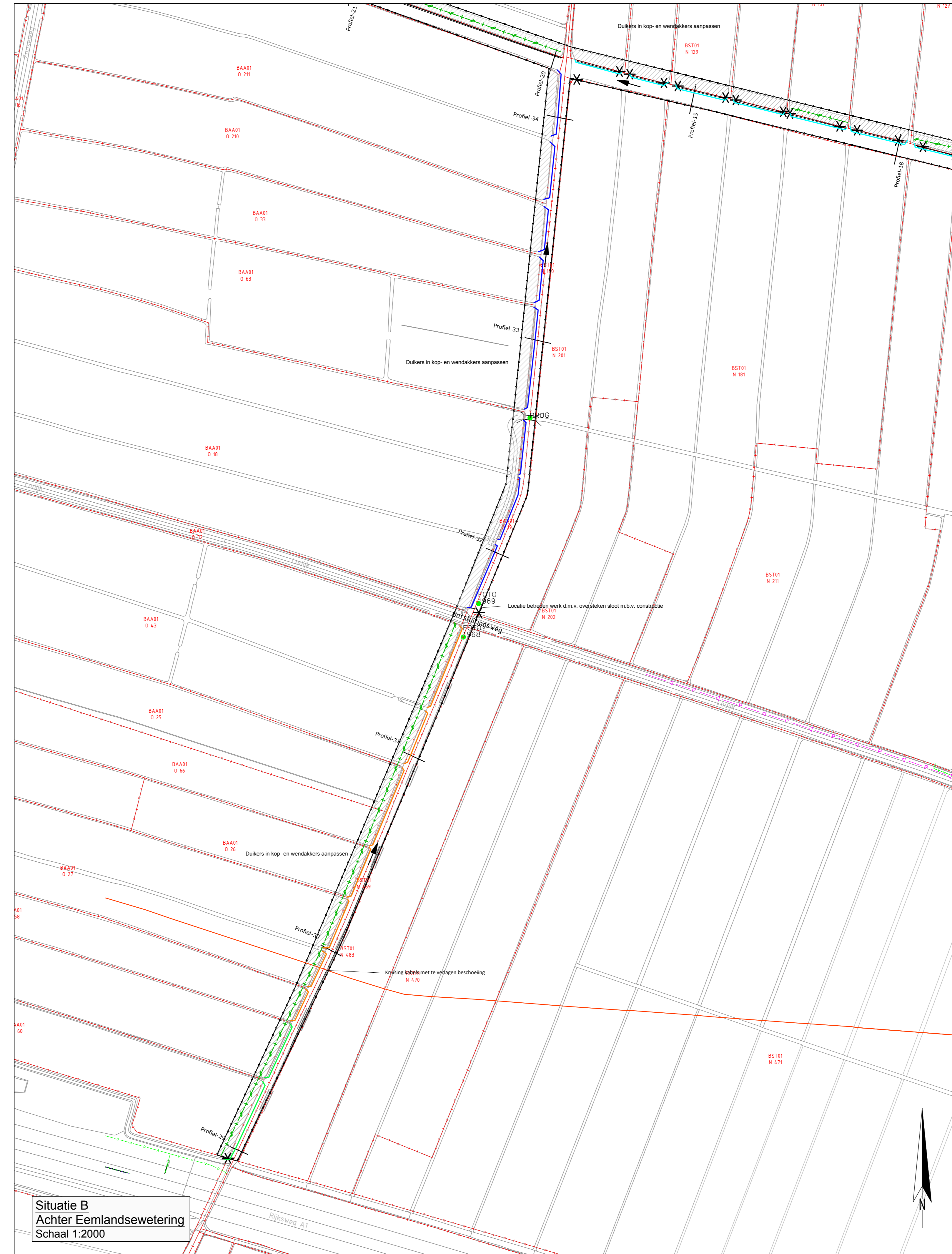
Situatie B Achter Eemlandsewetering Schaal 1:2000