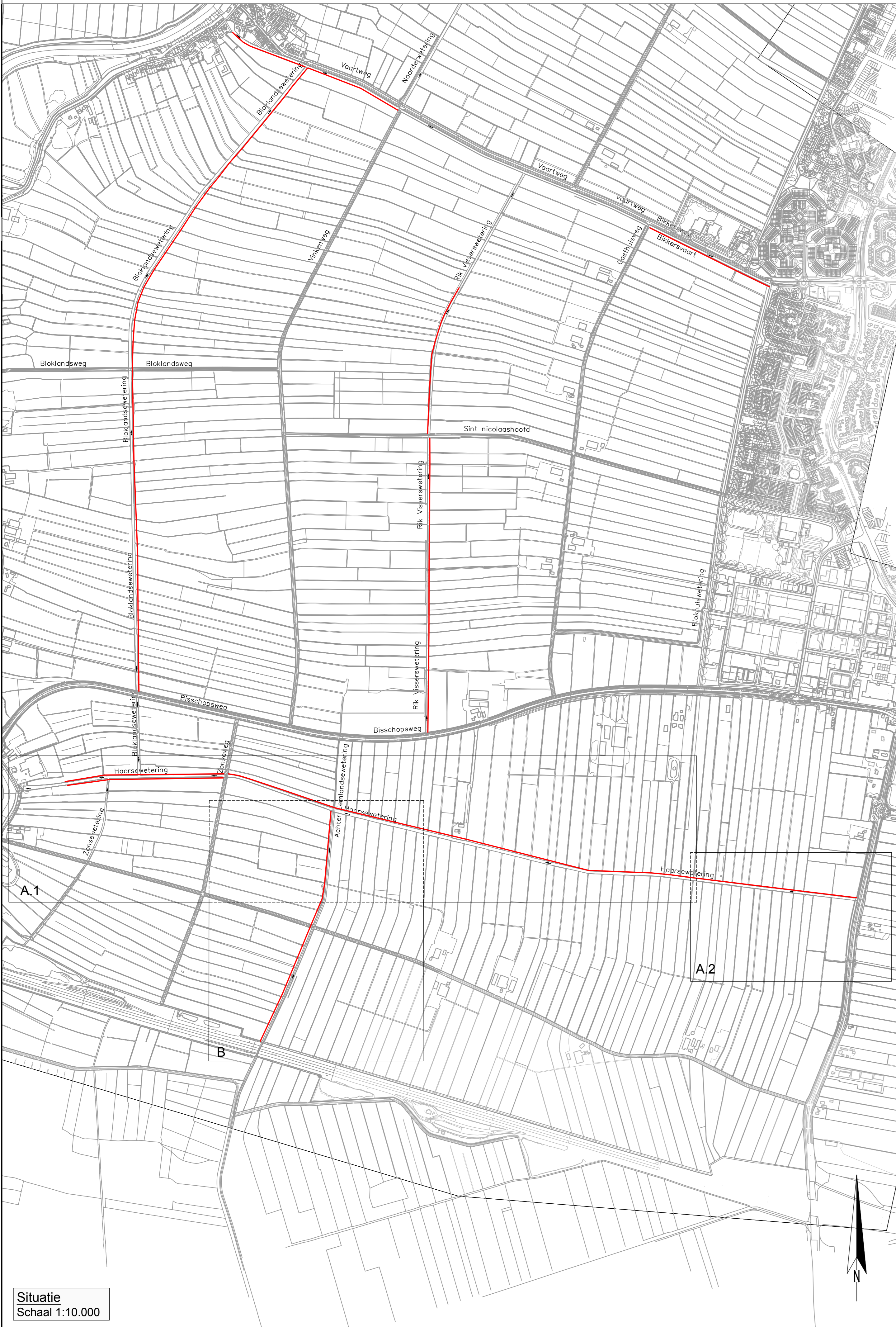
Situatie B Achter Eemlandsewetering Schaal 1:10.000