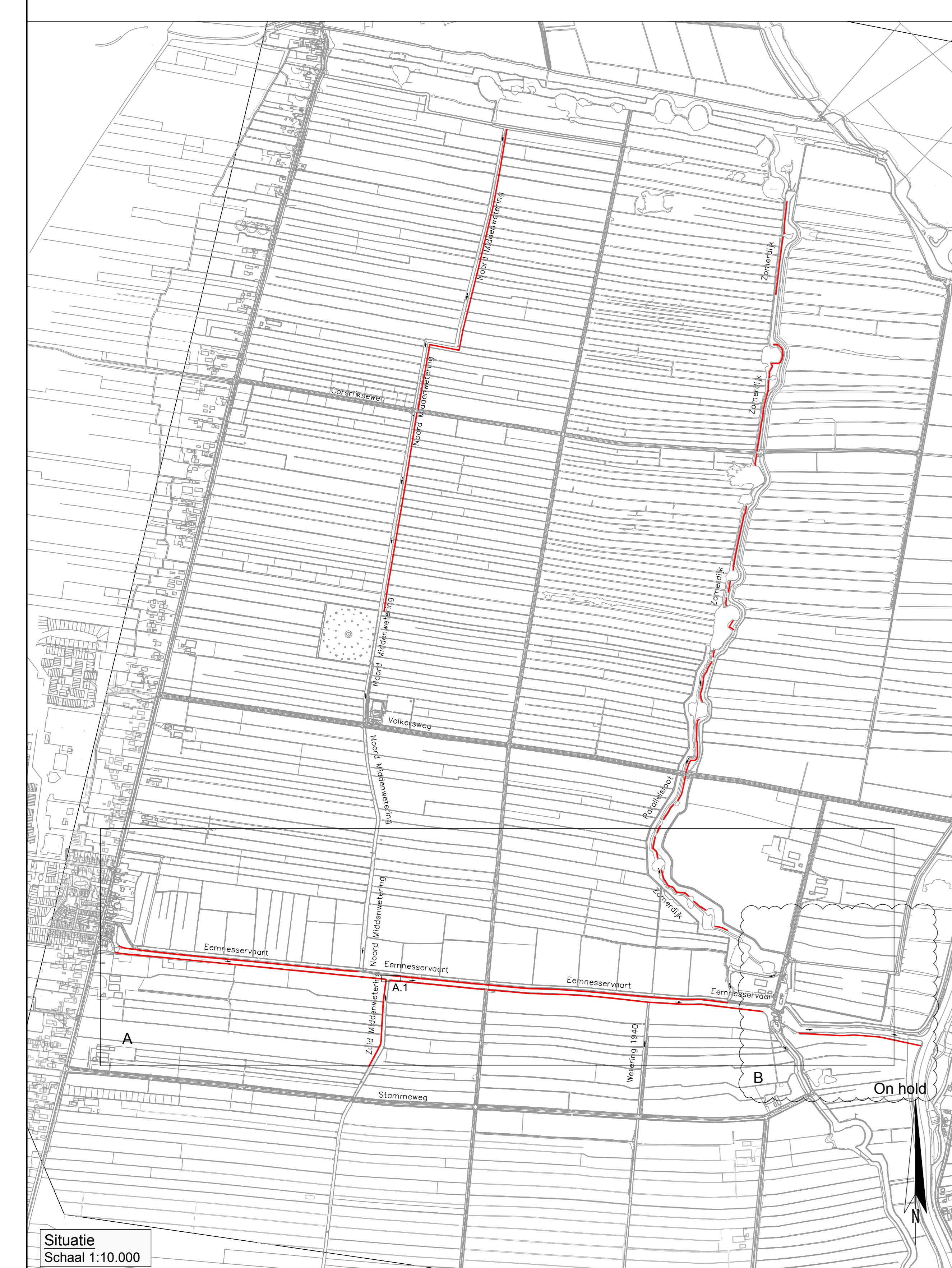
Situatie Schaal 1:10.000