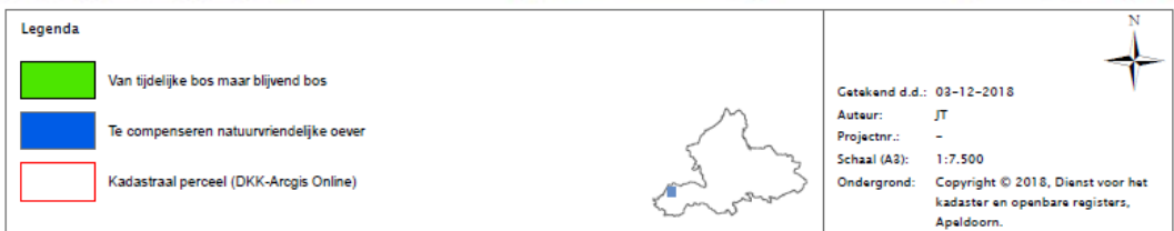
Figuur 1: Ligging van de te kappen stroken bos ten behoeve van de ecologische verbindingzone (donkerblauwe lijnen) en ligging van het compensatieperceel D917 (heldergroene aanduiding).