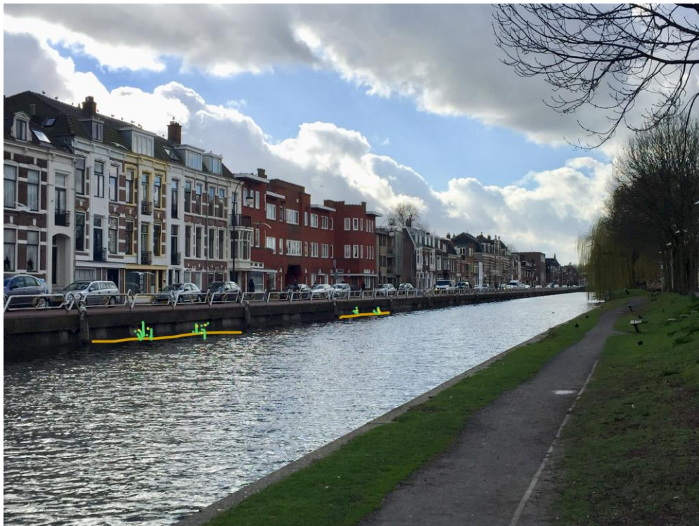
FUP met watertuin (16 m.) locatie 2 en 3