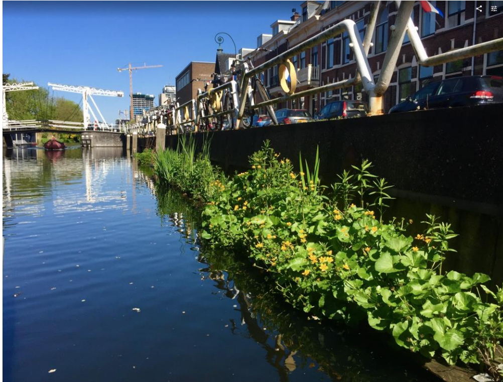
Watertuinen in Leidsche Rijn tussen J.P. Coenbrug en Abel Tasmanbrug