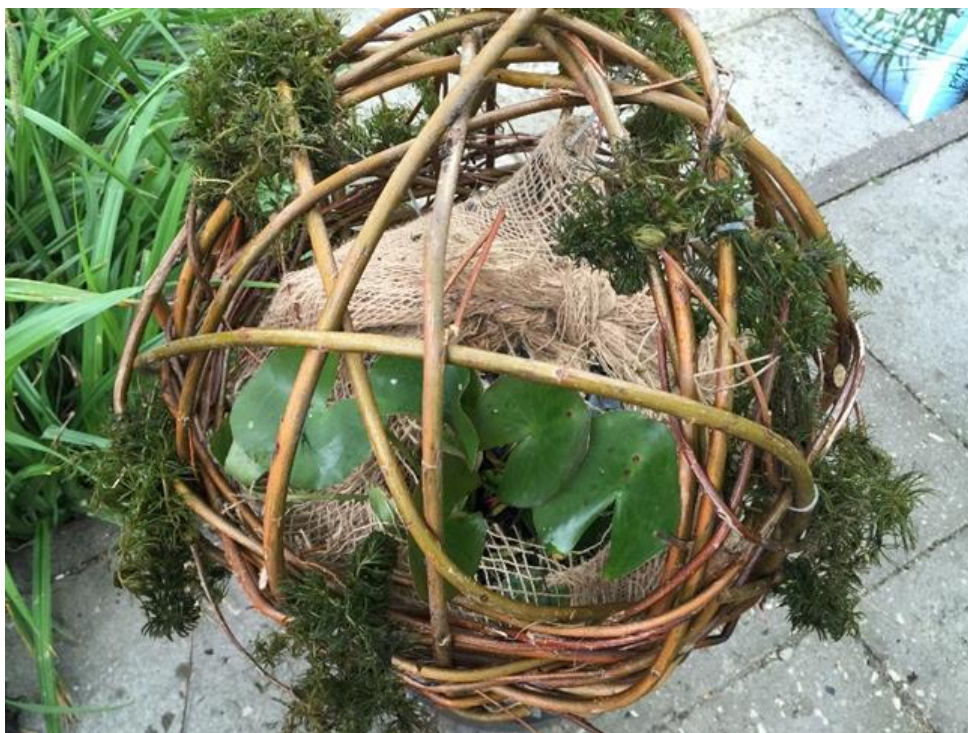
Wilgentenenbol met drijfbladplanten en zuurstofplanten