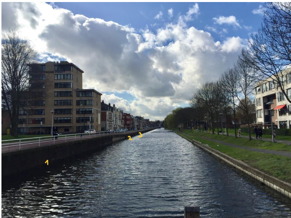
FUP locaties 1, 2 en 3 Leidsche Rijn langs de Leidseweg