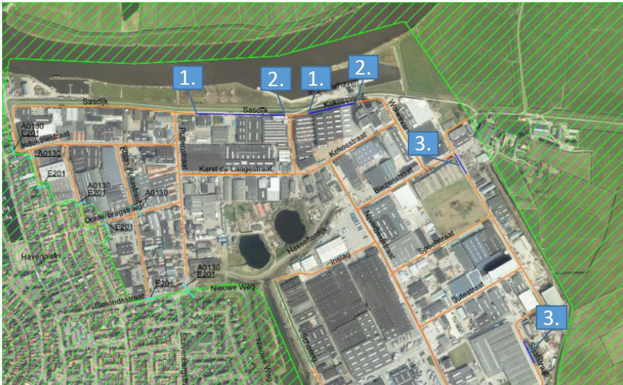
Noordelijk gedeelte bedrijventerrein Zevenhont te Genemuiden