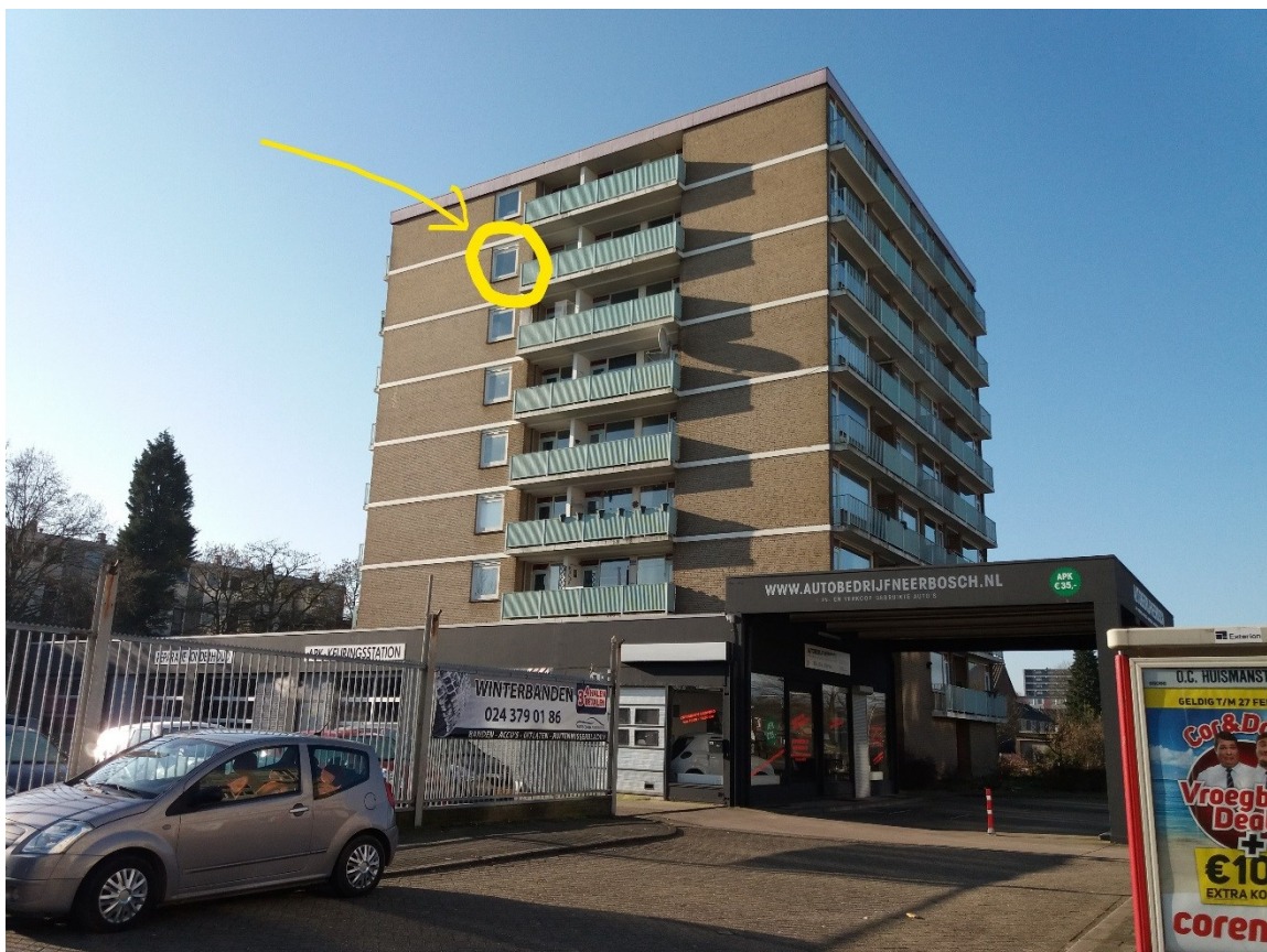
Het te renoveren gebouw. Geel omcirkeld de plaats van de verblijfplaats.