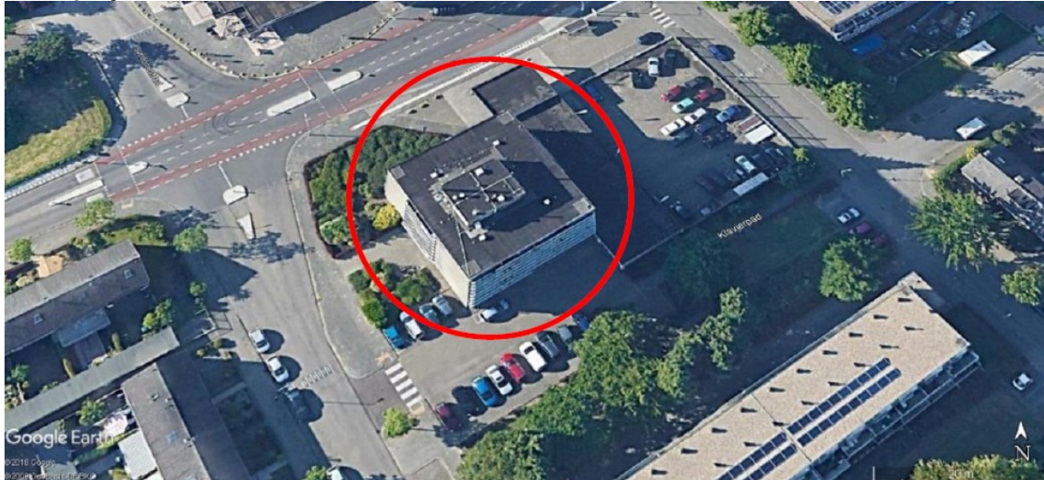
Plangebied Symfoniestraat te Nijmegen