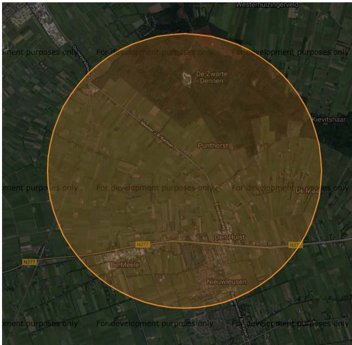
Figuur 2. Weergave Natura- 2000 gebieden in relatie tot het zuidelijke projectgebied

Bovenstaande uitsneden zijn afkomstig van de website https://www.synbiosys.alterra.nl . Via deze website wordt beoordeeld of een ontwikkeling negatieve effecten hebben op omliggende Natura 2000-gebieden. In dit geval is in een omtrek van 3 kilometer van het projectgebied geen Natura 2000-gebied aanwezig.