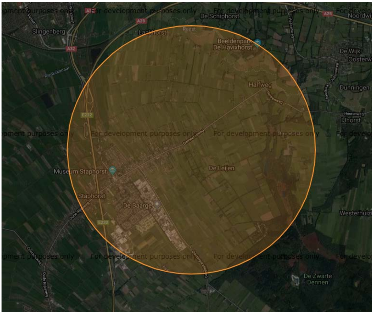
Figuur 1. Weergave Natura- 2000 gebieden in relatie tot het noordelijke projectgebied