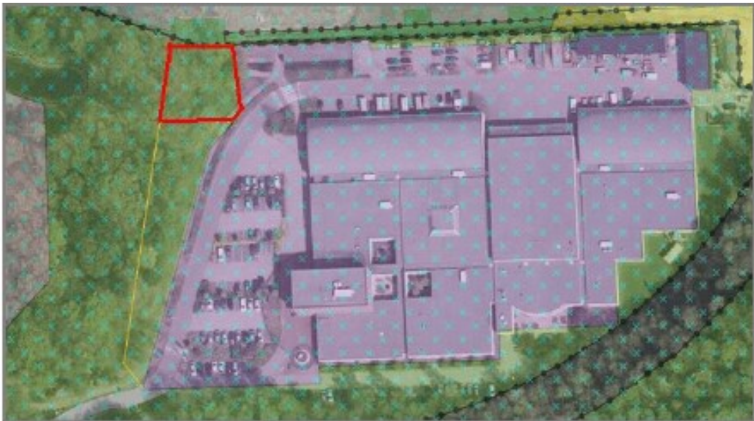
Figuur 1. Begrenzing plangebied (paarse vlak) en uitbreiding parkeerplaats (rood omkaderd).