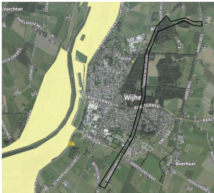
Kaart Natuurnetwerk Nederland

De projectgebied ligt op ongeveer 1 km van gronden die deel uitmaken van het Natuurnetwerk Nederland. De werkzaamheden zullen alleen vlak naast de Zandwetering plaatsvinden. Dit zorgt er voor dat de bestemming en doelen van de aanliggende gronden niet veranderen.