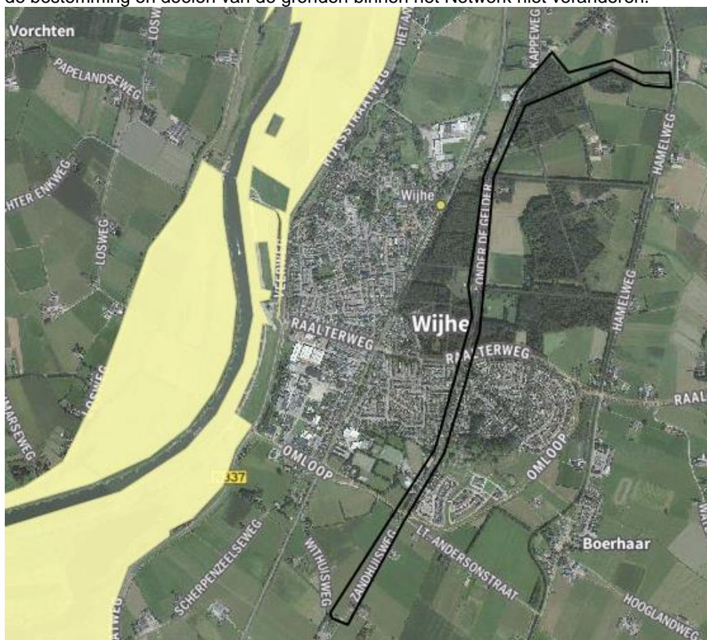
Kaart Natuurnetwerk Nederland

De projectgebied ligt op enige afstand van gronden die deel uitmaken van het Natuurnetwerk Nederland. De werkzaamheden zullen alleen rond de Zandwetering plaatsvinden. Dit zorgt er voor dat de bestemming en doelen van de gronden binnen het Netwerk niet veranderen.