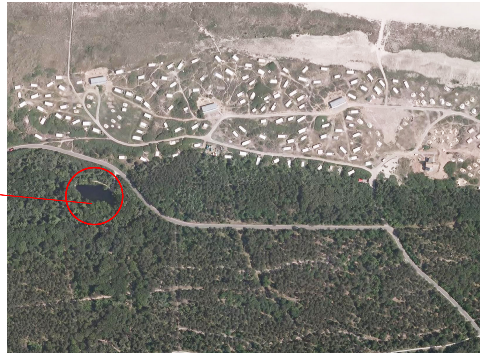
situatietekening westelijk deelgebied 1:500

BLUSWATER TE HALEN UIT MEERTJE KLAAS DOUWES