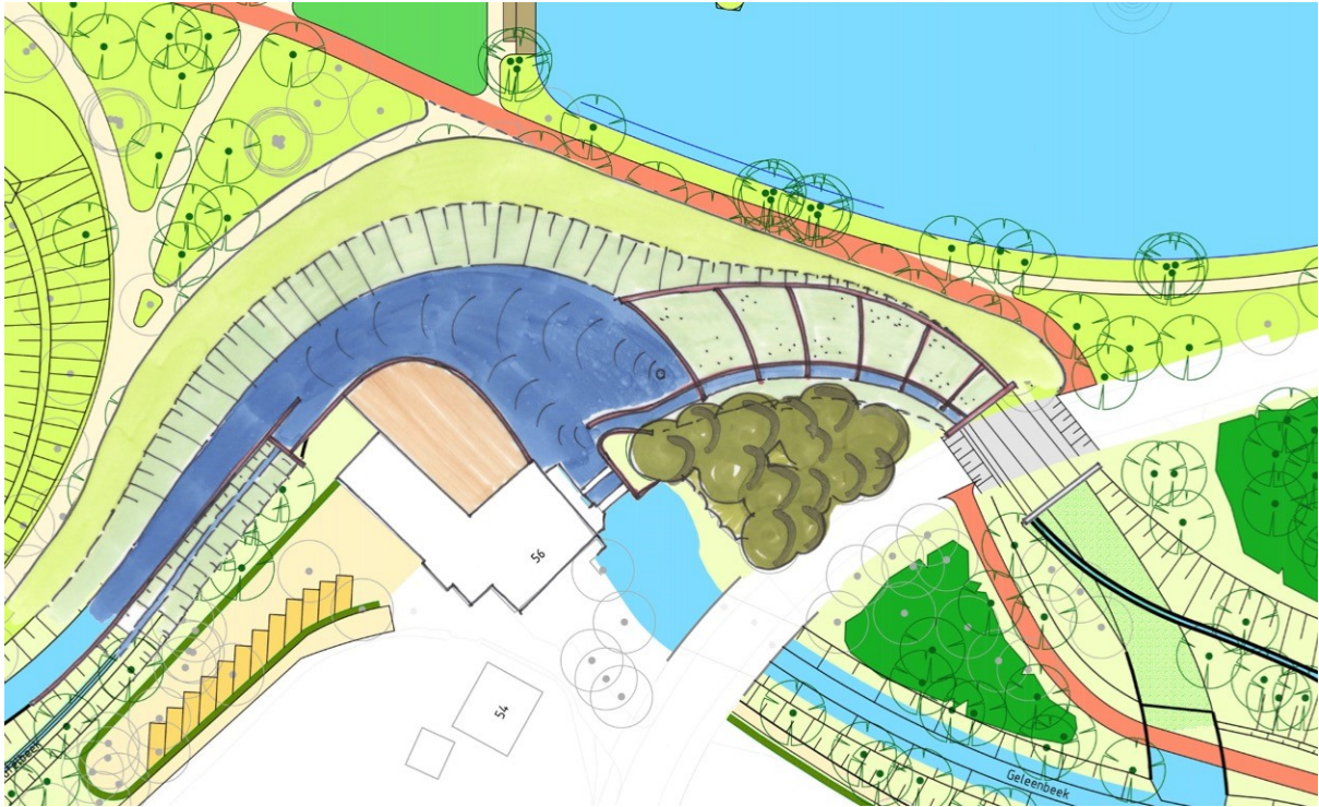
Figuur 3. Basisvariant : twee waterdoorgangen Molenweg, gecombineerde vispassage en hoogwatergeul.