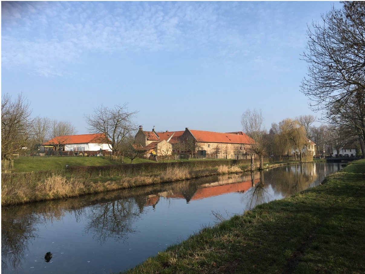
Figuur 2: Huidige situatie ter plaatse van de Ophovenerhof en Ophovenermolen.