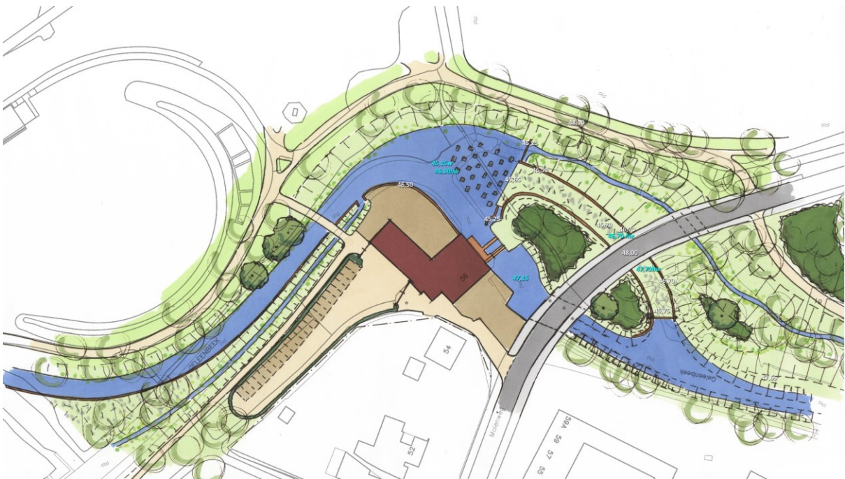
Figuur 4. Alternatieve variant: drie waterdoorgangen Molenweg; gescheiden vispassage en hoogwatergeul.

Wat zijn de voordelen van de basisvariant?