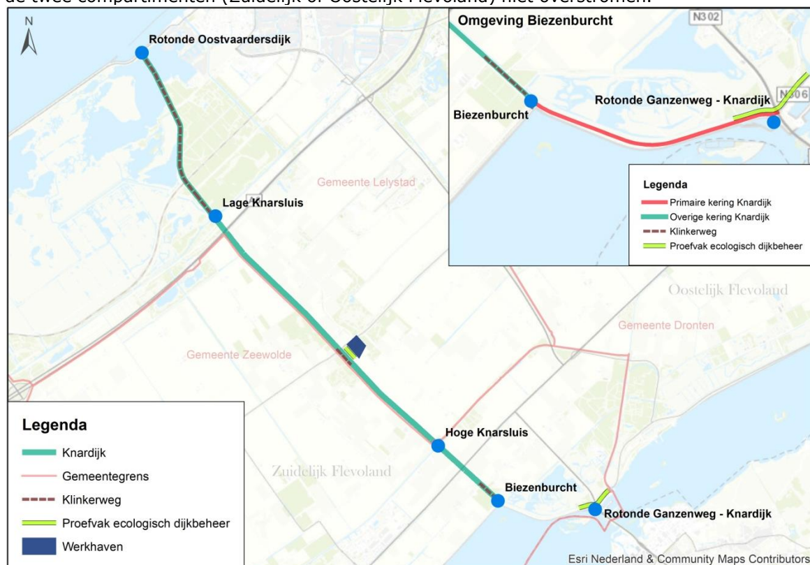
Figuur 1: ligging Knardijk

Waterschap Zuiderzeeland is beheerder en eigenaar van de 18 kilometer lange Knardijk, gelegen op de grens tussen Zuidelijk en Oostelijk Flevoland. De Knardijk ligt deels in de gemeente Zeewolde en voor een deel in de gemeente Lelystad (zie figuur 1 hieronder). Voorheen was de Knardijk een zogenaamde compartimenteringskering. Wanneer de primaire kering aan de rand van de polder zou falen, zou de Knardijk het water permanent moeten kunnen keren. Zo zou één van de twee compartimenten (Zuidelijk of Oostelijk Flevoland) niet overstromen.