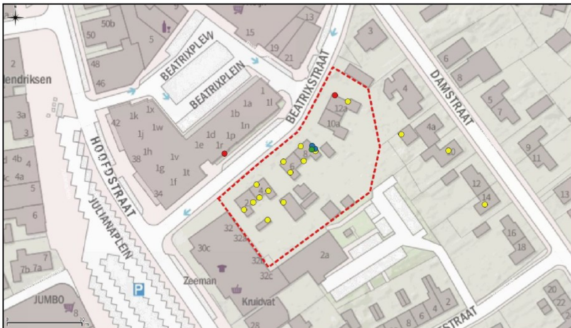
Figuur 2: Kaart van het plangebied (rood omkaderd). Aangegeven de aangetroffen nest- en verblijfplaatsen. Huismus = geel, gierzwaluw = blauw, gewone dwergvleermuis = rood, laatvlieger = groen.