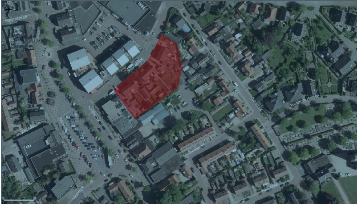
Figuur 1: Luchtfoto van het plangebied (rood gearceerd)