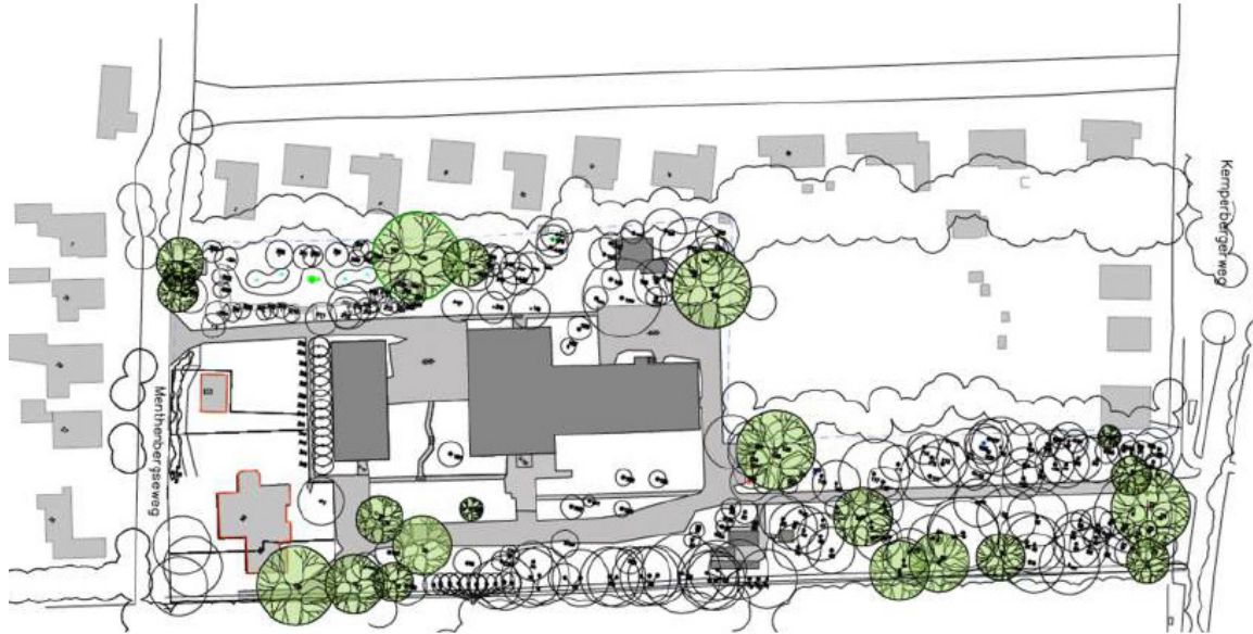
Figuur 1: Huidige situatie