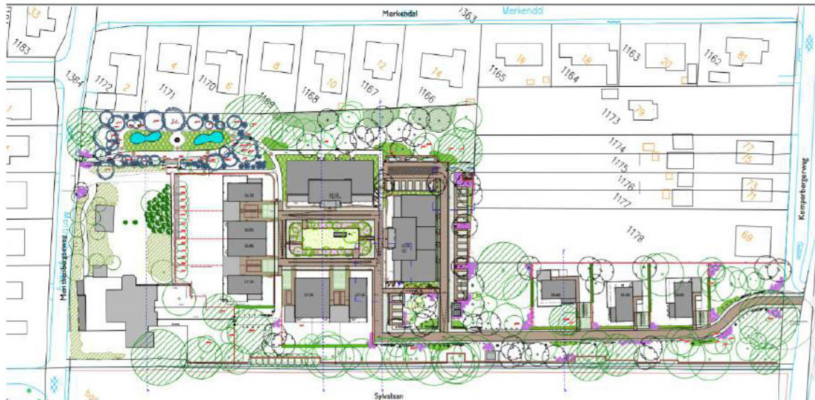
Figuur 2: Beogde situatie