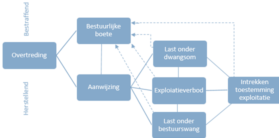
Figuur 2: Schematische weergave van alle herstellende en bestraffende sancties