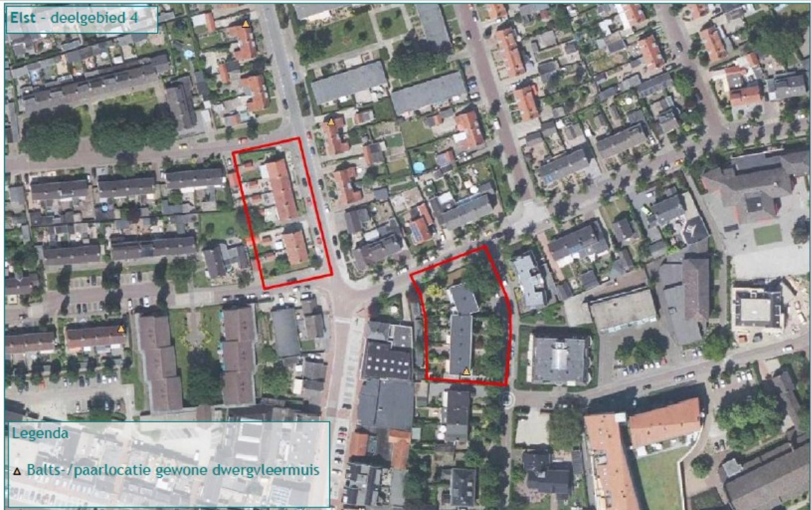
Figuur 3: Ligging van waarnemingen aan balts- en paarlocaties van de gewone dwergvleermuis (de gele driehoek) bij woningen aan de Oranje Nassaustraat te Elst (binnen de rechter rode contouren).