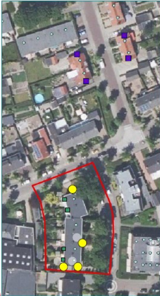
Figuur 5: Overzicht van te nemen maatregelen in en rond het plangebied.