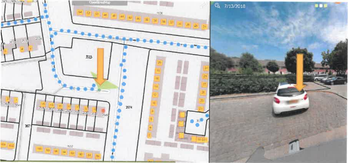
Den Ouden Dries