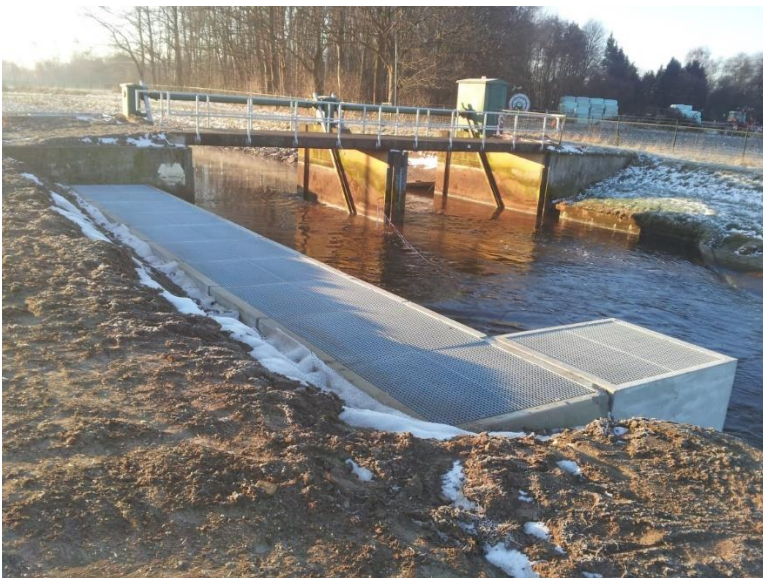
Figuur 5. Referentiefoto van een De Wit-vispassage langs een stuw, in dit geval in de Aa bij Veghel

In figuur 5 is een referentiebeeld van een De Wit passage langs een stuw weergegeven.