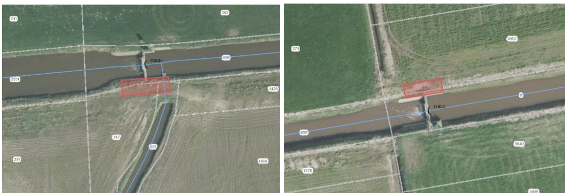
Figuur 6. Projectcontouren locaties 118CH en CC. De in te passen technische vispassages passen binnen een maximale ruimteclaim van 10 meter lang en 4 meter breed ter plaatse van de stuwen.

Voor een De Wit vispassage wordt standaard uitgegaan van een peilsprong per trap van 5 cm. Voor zowel stuw 118CC als 118CH wordt voor het ontwerp uitgegaan van een peilverschil van 45cm. Dat is de waarde waarmee de vispassage in de migratieperiode (februari-juni) 95% van de tijd zal functioneren. Dit komt dus neer op maximaal 9 bekkens voor beide vispassages. De bekkens hebben een afmeting van 1,20 x 1,00 (BxL) met doorzwemvensters van 0,20 x 0,30m. Halverwege wordt een rustbekken ingebouwd die twee keer zo lang is. De totale constructie, uitgaande van een De Wit vispassage, krijgt hiermee een afmeting van maximaal 10m lang en 1,20m breed. Bij de nadere uitwerking van het ontwerp wordt dit nog verder geoptimaliseerd en kan mogelijk het aantal bekkens worden verminderd. Een eventueel toepasbaar innovatief vispassage ontwerp past binnen de in figuur 6 aangegeven projectcontour. Beide vispassages worden aan beide zijden voorzien van een schuifafsluiter.