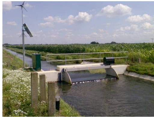
Figuur 2. De huidige stuw 118CH.