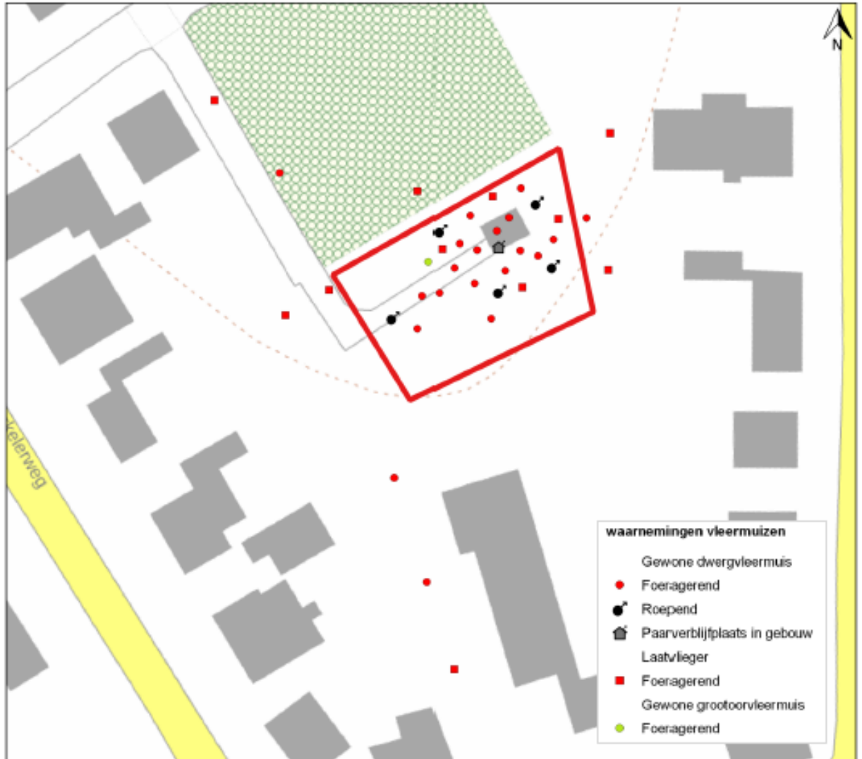
Figuur 3: Ligging van waarnemingen aan gewone dwergvleermuis, gewone grootoorvleermuis en laatvlieger in en rond het plangebied.