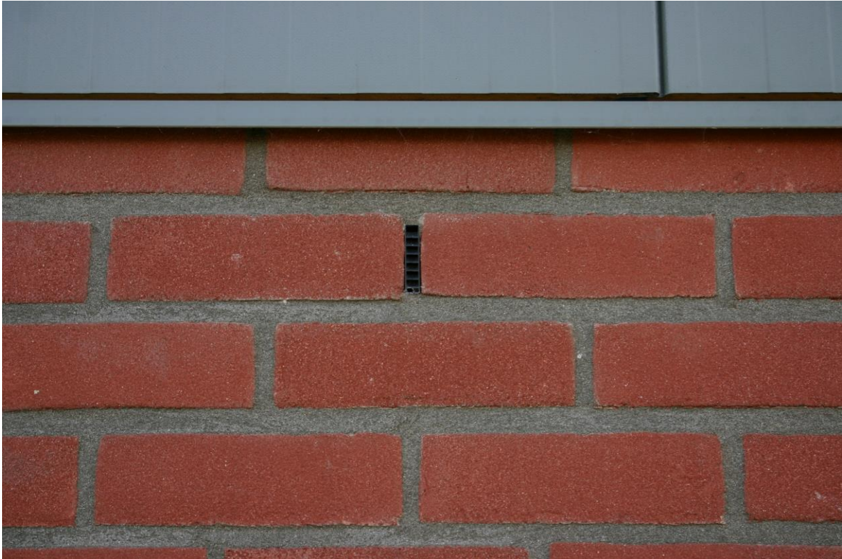
Figuur 4.2.1. Detailopname van een loods naast het plangebied; de open stootvoegen zijn voorzien van roosters en de damwanden sluiten nauw aan op het onderliggend metselwerk.