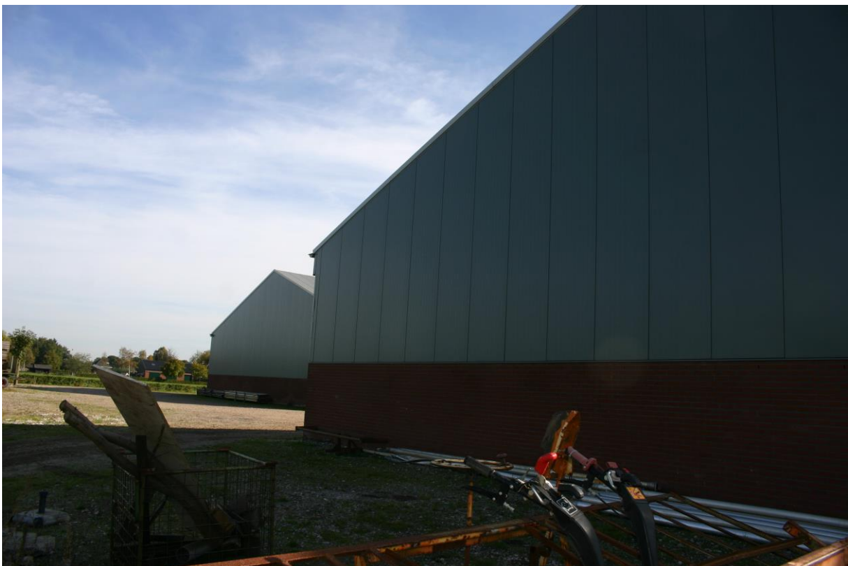
Figuur 4.2.2. Achterzijde van de loodsen waarin jaarlijks mogelijk de zwarte roodstaart broedt.