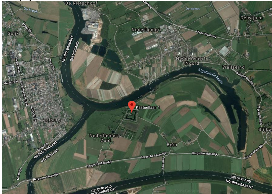
Figuur 1: Locatie ooievaarsnest op schoorsteen Kasteel Nederhemert, Kasteellaan 1 te Nederhemert