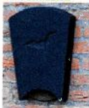
vleermuiskasten type VK WS 01 1