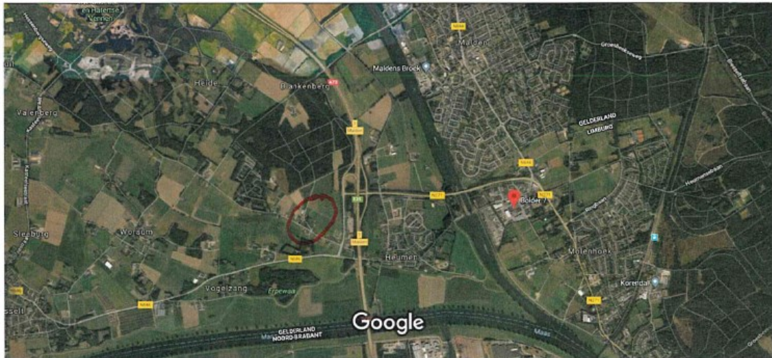
Figuur 2. Uitzetlocatie (rood omcirkeld).