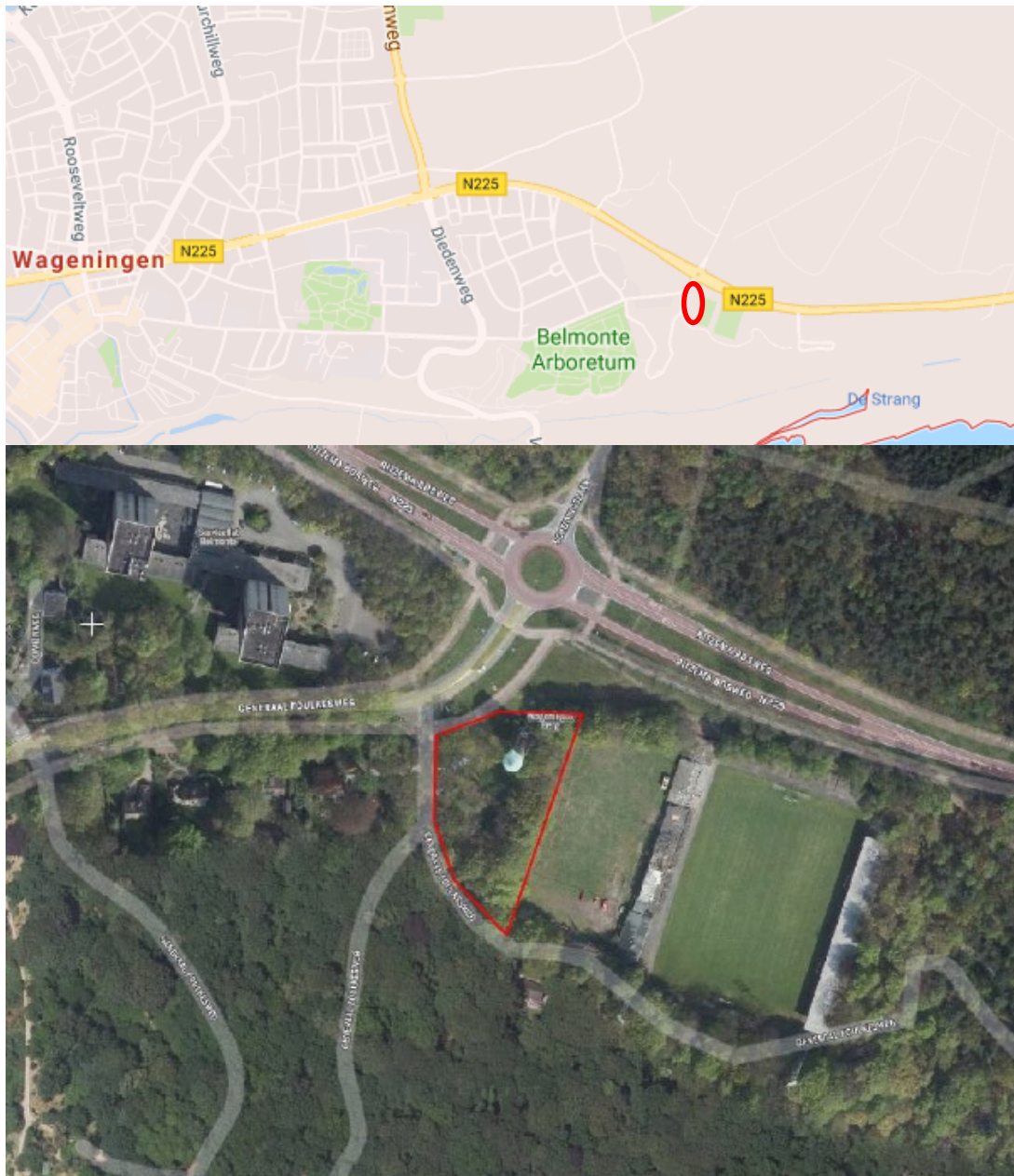
Figuur 1 Ligging (rode cirkel) en begrenzing plangebied (rodomlijnd).