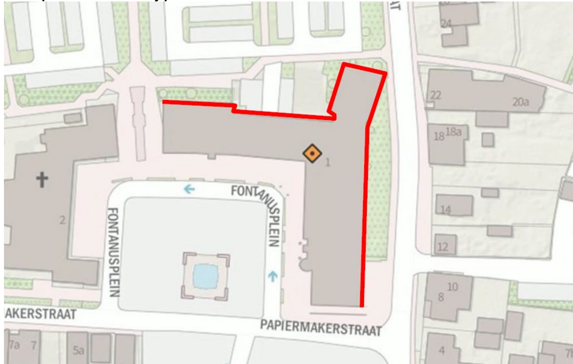
Figuur 3: Zijden van het gemeentehuis waar permanente verblijfplaatsen voor de gewone dwergvleermuis en de laatvlieger zijn gepland