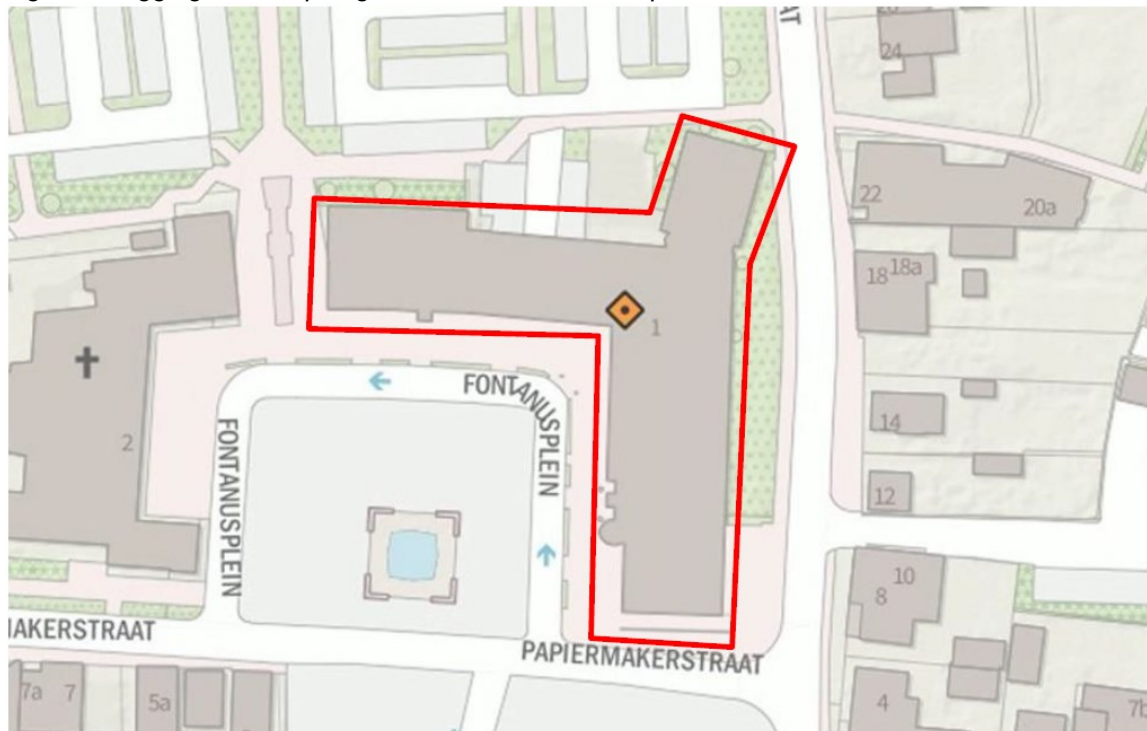
Figuur 1: Ligging van het plangebied aan het Fontanusplein te Putten.